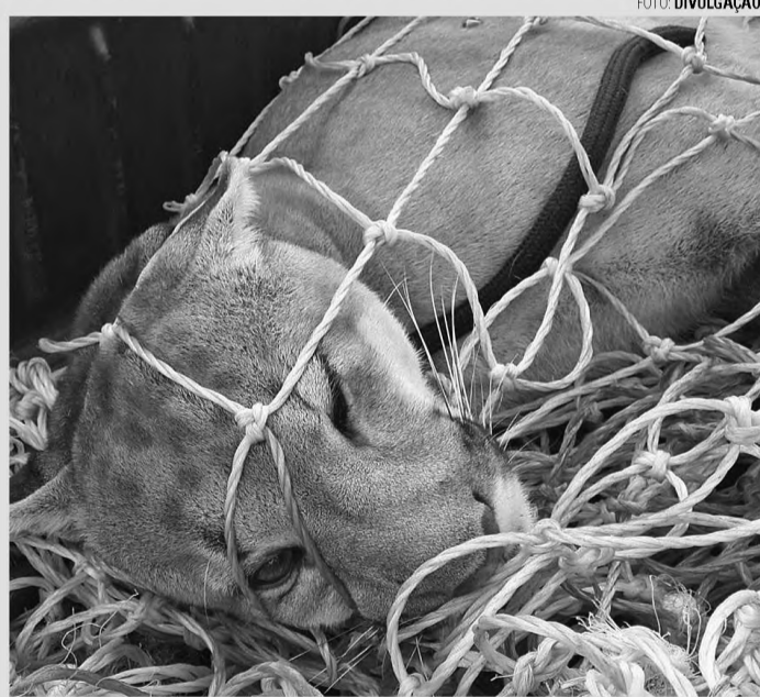
ATROPELADA - A onça suçuarana foi encontrada atropelada na rodovia Osny Matheus; este é o terceiro atropelamento em sete meses

Em fevereiro deste ano, uma onça suçuarana fêmea foi capturada no parque Vitória Régia Bauru. A onça atraiu centenas de curiosos ao local. Após o resgate, o felino voltou ao seu habitat natural. Até hoje não se sabe ao certo como a suçuarana foi parar na região central de Bauru.