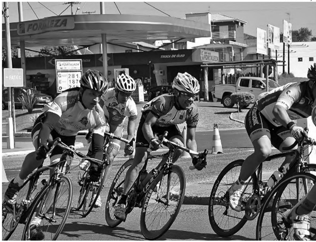
NO PEDAL - Nos esportes coletivos o ciclismo (centro) foi o que levou a melhor para Lençóis, ficando com o bronze

Lençóis Paulista vive novamente o dilema das cidades pequenas que disputam os Jogos Regionais na primeira divisão, entre as potências do esporte. No ano passado com uma cam-