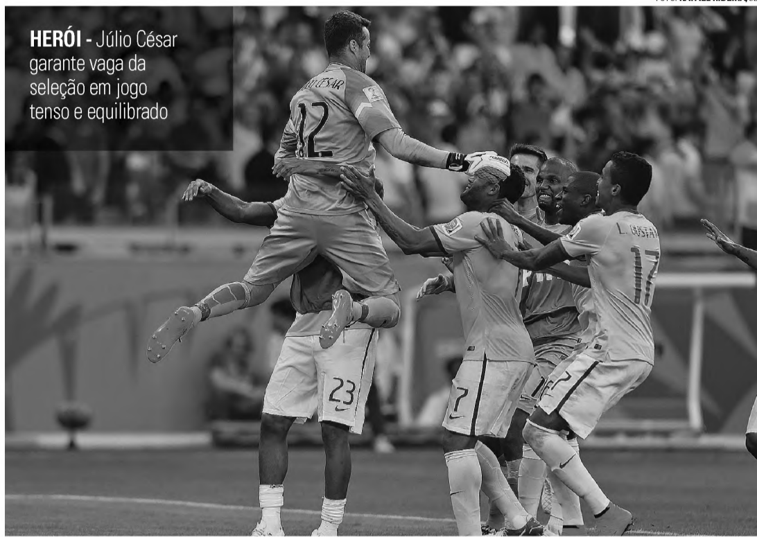
HERÓI - Júlio César garante vaga da seleção em jogo tenso e equilibrado