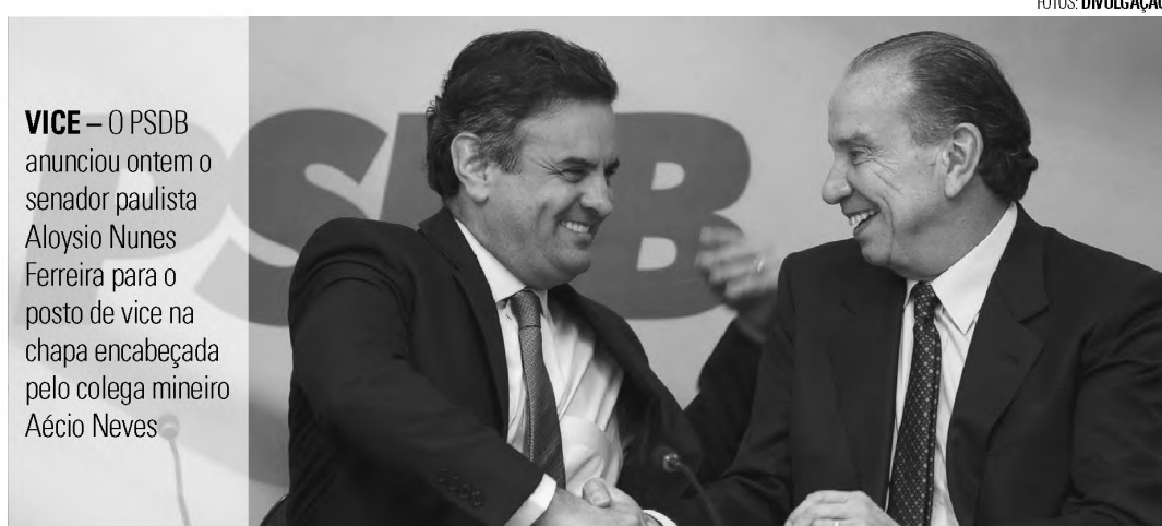
VICE – O PSDB anunciou ontem o senador paulista Aloysio Nunes Ferreira para o posto de vice na chapa encabeçada pelo colega mineiro Aécio Neves

Por uma disputa interna, ainda faltava definir o nome do candidato do PSDB para a vaga ao Senado. Segundo interlocutores próximos ao núcleo tucano até ontem três nomes eram cotados para ocupar o posto.