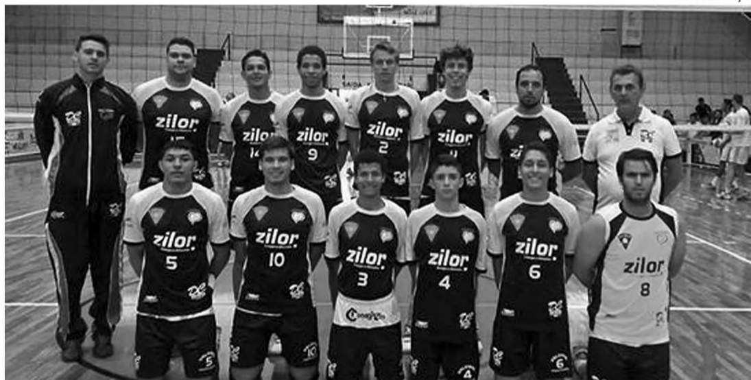
DEVER CUMPRIDO - Equipe de vôlei de Lençóis volta para casa satisfeita com boa colocação nos Regionais