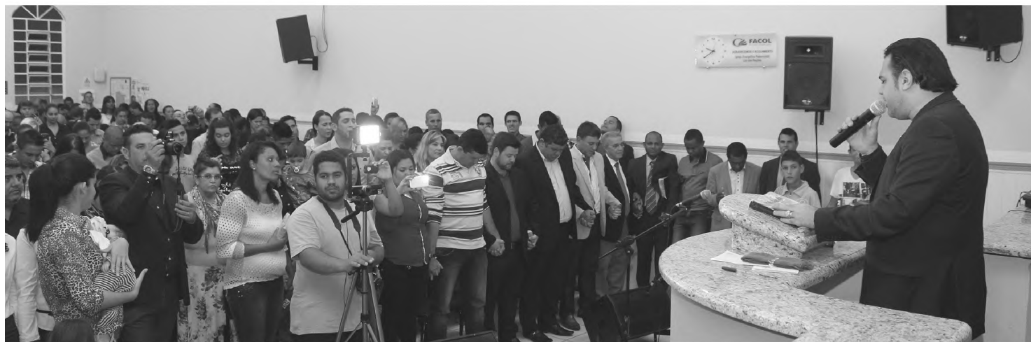
PASTOR – O deputado federal Marco Feliciano esteve em Lençóis neste final de semana; políticos e população marcaram presença no culto ocorrido na Igreja Pentecostal Luz para as Nações, no Jardim Santa Terezinha