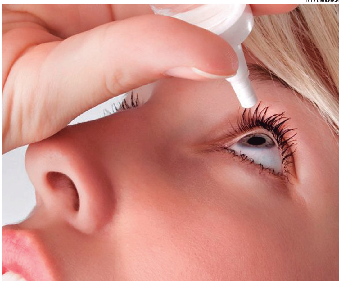
COLÍRIOS - Além do cuidado hormonal, os colírios são uma boa opção para amenizar a secura dos olhos

"É importante que a mulher na menopausa saiba que os sintomas desagradáveis podem ser aliviados sem intervenções mé-