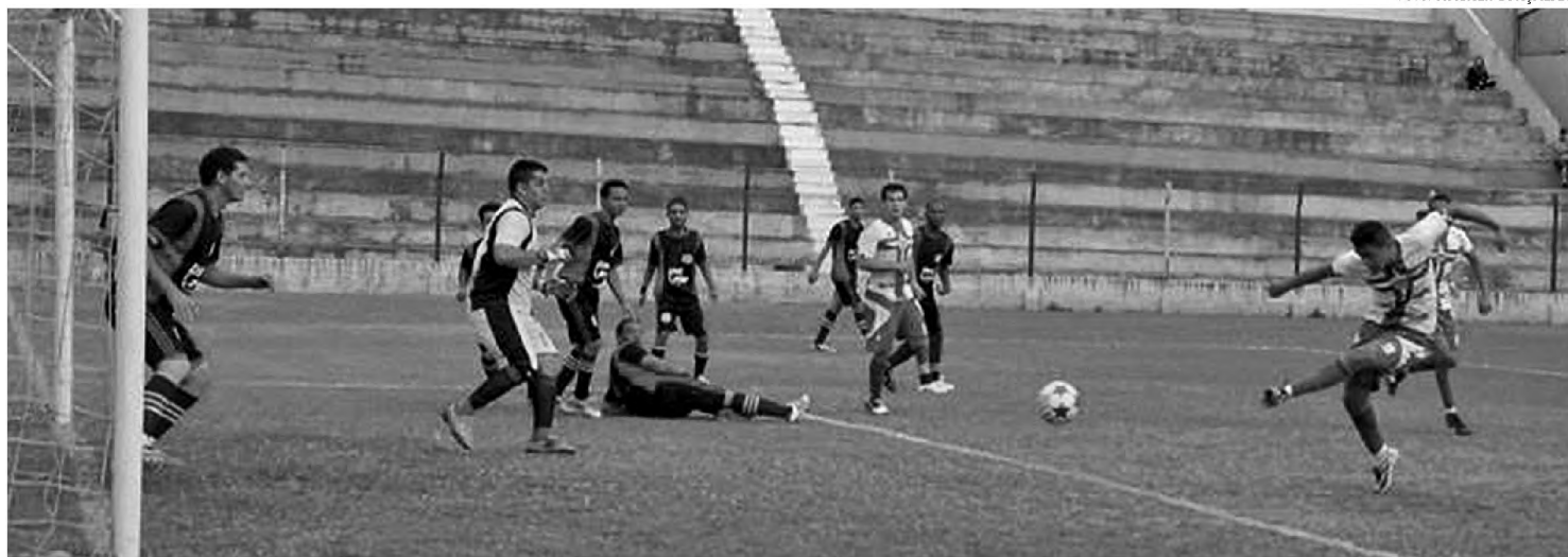
CLASSIFICADOS - Nova Lençóis e Sport Ferrari jogaram no último final de semana e conquistaram as vagas do grupo A para próxima fase