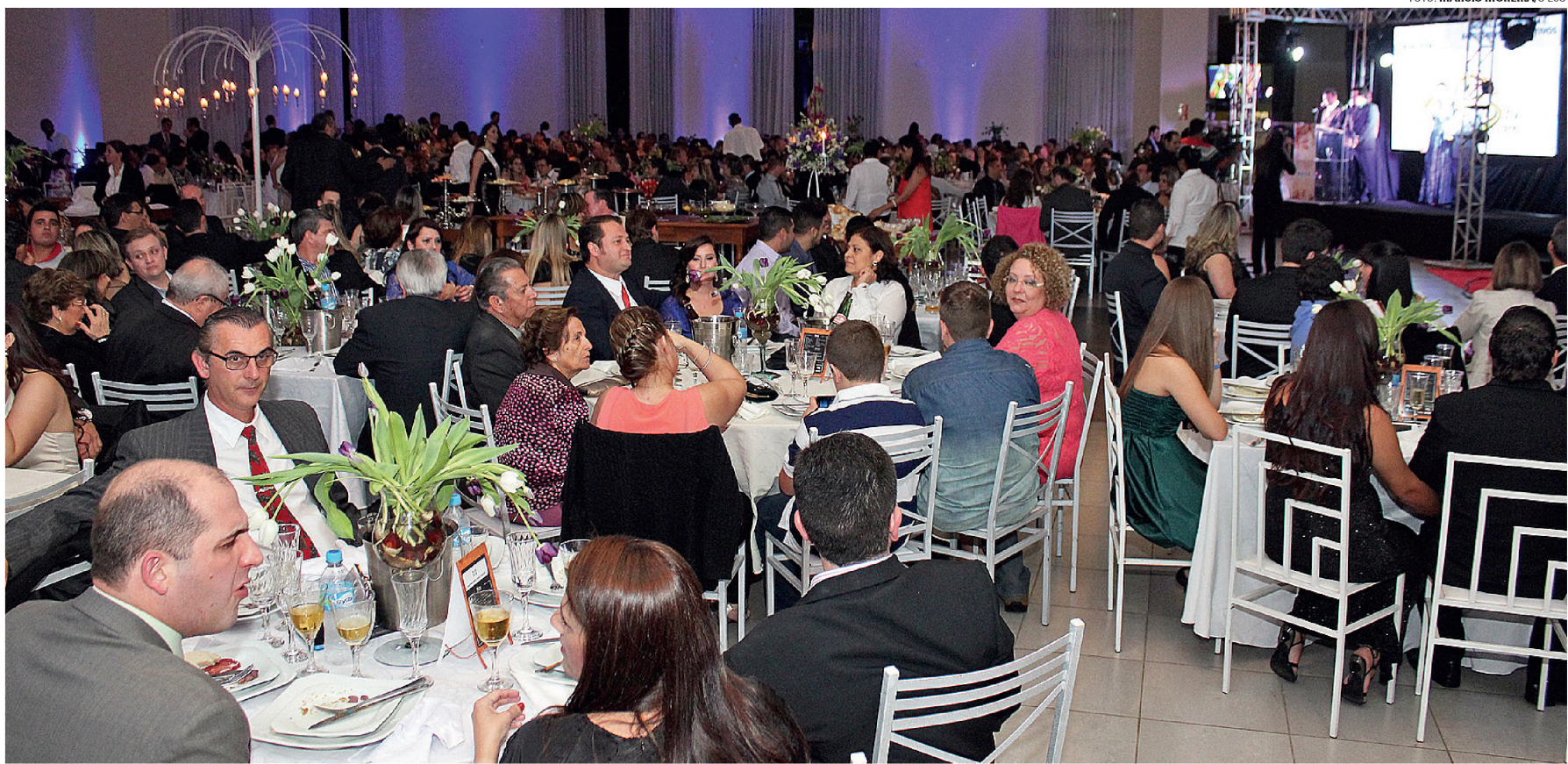
SOLENIIDADE - Empresários e personalidades de Lençóis e região prestigiaram o evento promovido pelo jornal O ECO no último sábado, 16, no Clube Esportivo Marimbondo

A rodada de domingo definiu mais dois classificados para a semifinal da série B do Campeonato Amador de Lençóis Paulista - Troféu Dé Mazzini. A definição saiu dos jogos decisivos, entre as equipes do grupo A. Na primeira partida, às 8h, o Nova Lençóis ganhou de 2 a 1 do Atlético Kajú e às 10h, o Sport Ferrari derrotou o Atlético Ubirama por 4 a 2. Com a vitória, Nova Lençóis e Sport Ferrari, com sete e seis pontos, respectivamente, garantiram as duas primeiras colocações do grupo A e a classificação. O Sport Ferrari vai enfrentar o Asa Branca, que já estava classificado como primeiro do grupo B.