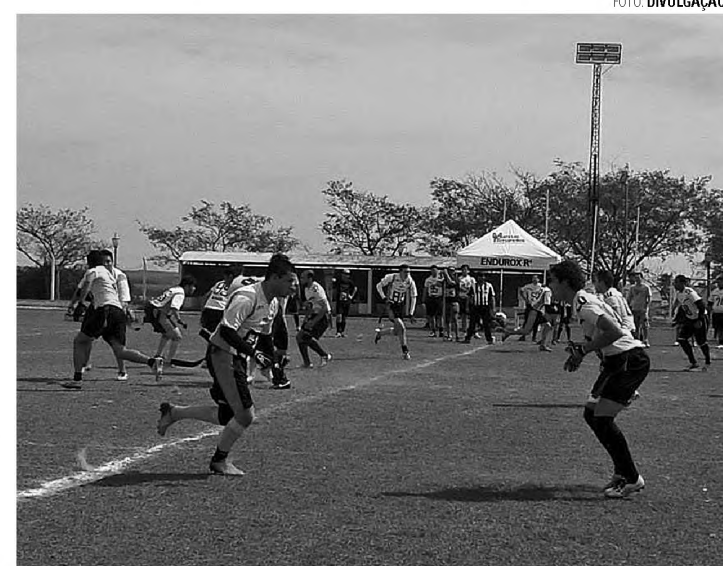
TÁ DIFÍCIL - Readers se esforça, evolui, mas vitória não chega

De acordo com o técnico Murilo Gaspar Pascuotte a equipe adversária é bem forte, tendo inclusive, vencido o mesmo campeonato em 2010. Já o Readers é uma equipe recém criada, que disputa o seu primeiro campeo-