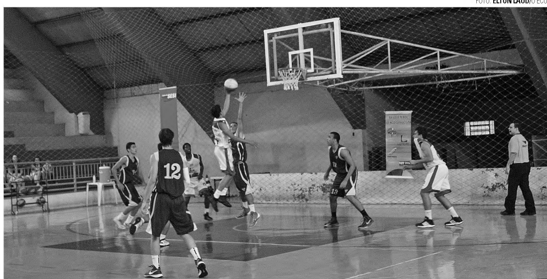
NA ESPERA - Depois de vencer na última rodada, Alba aguarda definição de sua situação no Paulista

Jogando em casa, a equipe derrotou o time de Mogi das Cruzes por 73 a 61