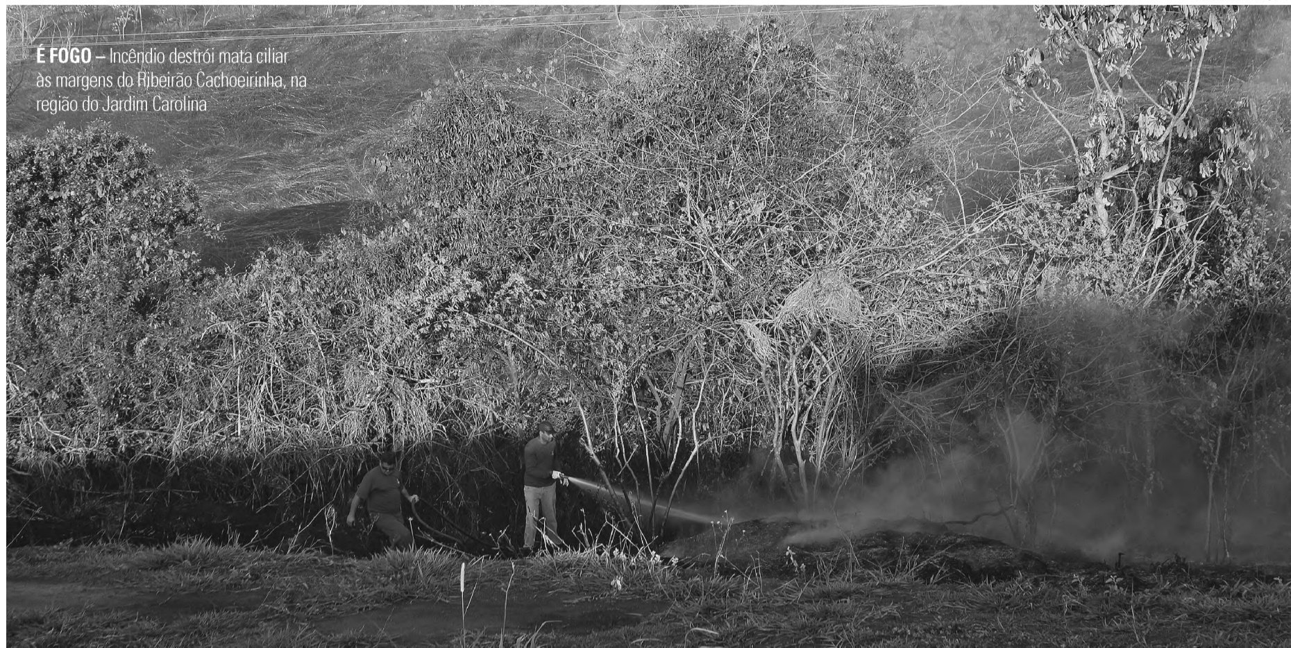
É FOGO – Incêndio destrói mata ciliar às margens do Ribeirão Cachoeirinha, na região do Jardim Carolina

"Nós tomamos conhecimento via Corpo de Bombeiros e também via de populares que ligaram no SAAE. A partir daí foi acionada a Defesa Civil do Município que contou com a participação de caminhões tanque do SAAE, de empresas do setor sucroenergético de nossa cidade, do Grupo Lwart. Na medida em que todos esses equipamentos foram acionados nós conseguimos debelar o incêndio que poderia, inclusive, ter causado um prejuízo muito maior", explica.