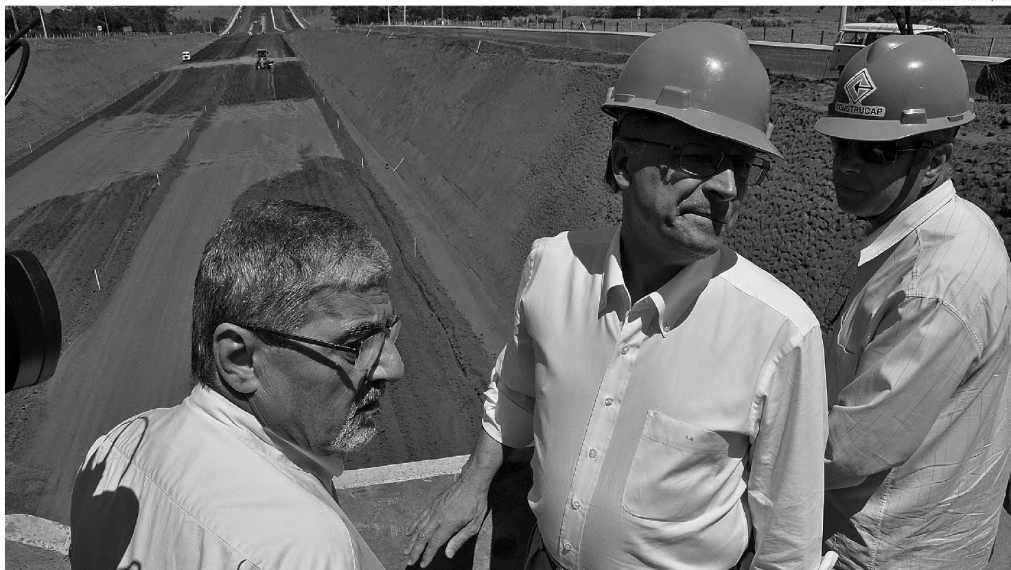
ELEIÇÃO - Geraldo Alckmin visitou ontem obras de duplicação da rodovia Bauru-Arealva e fez campanha na rua Batista de Carvalho

"Nem o Hospital Universitário (HU) de São Paulo, nem o Centrinho vão passar para a