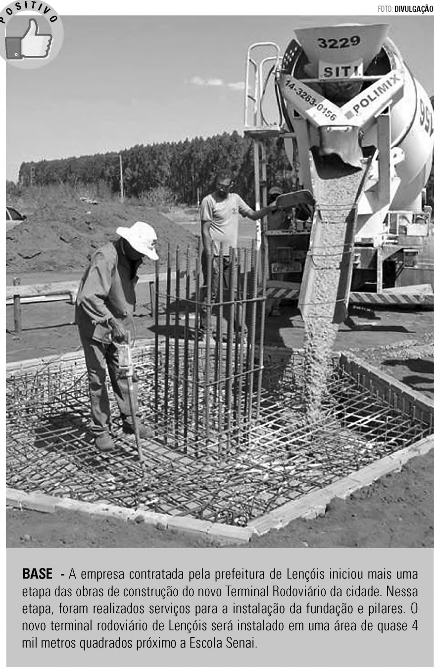
BASE - A empresa contratada pela prefeitura de Lençóis iniciou mais uma etapa das obras de construção do novo Terminal Rodoviário da cidade. Nessa etapa, foram realizados serviços para a instalação da fundação e pilares. O novo terminal rodoviário de Lençóis será instalado em uma área de quase 4 mil metros quadrados próximo a Escola Senai.

Toda pessoa – inclusive e principalmente a mulher – tem direito à intimidade, de ser fotografada ou filmada como bem entende e de enviar essas imagens para quem ela quiser. Cabe, no entanto, uma reflexão, em especial aos machos de plantão, sobre o peso que aquela imagem que você vê na tela do seu celular pode ter na vida de alguém a cada vez que ela é compartilhada.