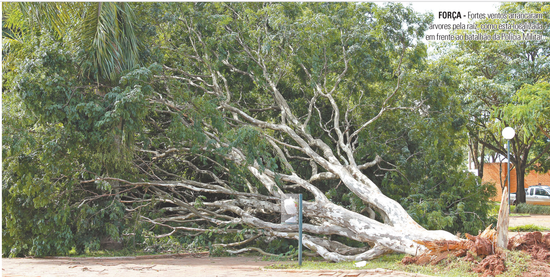
FOTO: FLÁVIA PLACIDELM/OECO FORÇA - Fortes ventos arrancaram árvores pela raiz, como esta localizada em frente ao batalhão da Polícia Militar

Ventos de até 70 km/h passaram por Lençóis Paulista e deixaram muita gente assustada no sábado 19. Em diversos pontos do município foram registrados quedas de árvores, casas destelhadas, placas amassadas e fornecimento de energia interrompido. Segundo a Defesa Civil, cerca de 50 árvores caíram, muitas delas arrancadas desde a raiz. O Posto de Saúde da Cecap teve parte do telhado destruído e, por medida de segurança, as vacinas tiveram que ser transferidas para outras unidades. A Prefeitura ainda trabalha para que tudo volte ao normal. A5