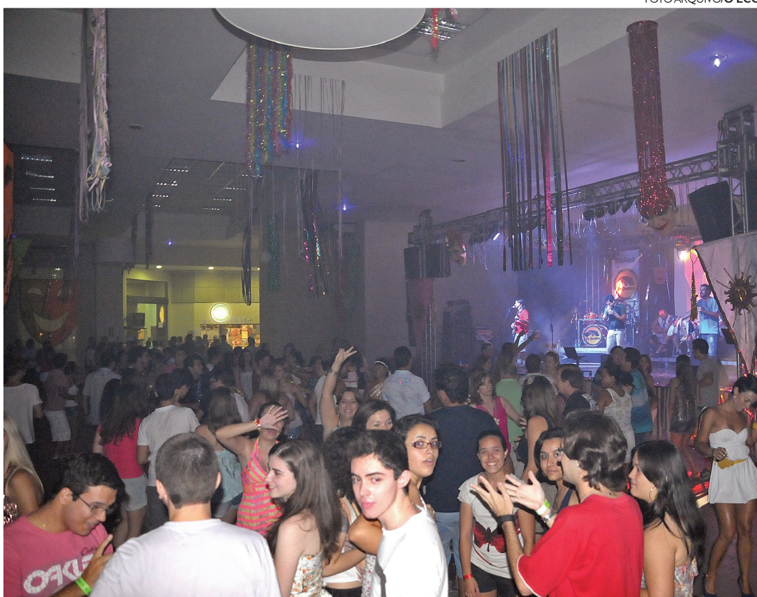
QUANTO RISO, QUANTA ALEGRIA - Foliões estão convidados a dar asas à imaginação e gastar toda sua energia na festa popular organizada pelo Clube Esportivo Marimbondo

Também já é tradição nos carnavais do Clube Marimbondo a premiação dos melhores blocos e melhores fantasias, tanto para a criançada que frequenta a matinê, quanto para os adultos que agitam nos bailes noturnos.