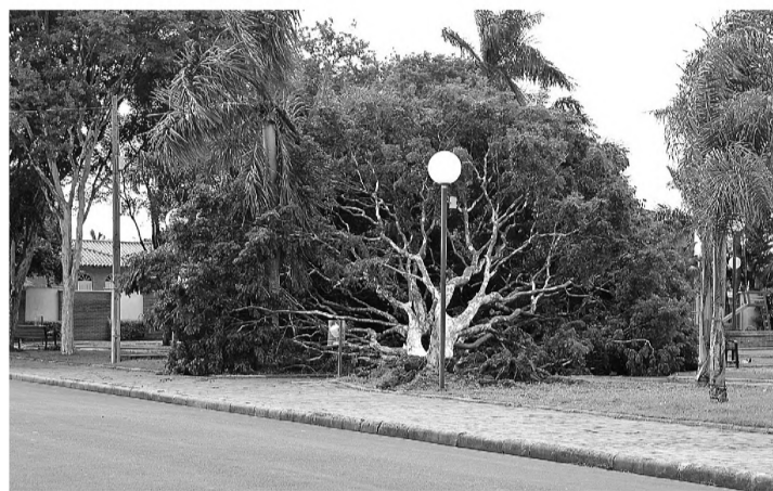
SUSTO - Temporal causou estragos em diversas partes da cidade