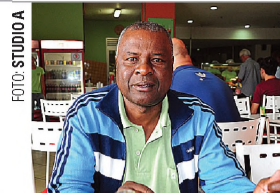
NO MENU Nelson, no Tempero Caseiro