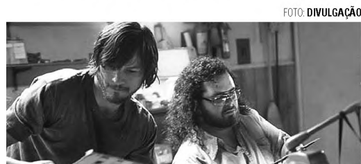
NA TELA - Ashton Kutcher e Josh Gad como Steve Jobs e Steve Wozniak, em cena do filme JOBS

Nem bem começou a divulgação do filme JOBS, que conta a história do início da vida profissional de Steve Jobs, começaram as críticas. Steve Wozniak, que junto com Jobs fundou a Apple, afirmou que as primeiras cenas divulgadas não retratam a realidade. "Não passou nem perto. As personalidades estão todas erradas, apesar de a minha ser a mais próxima", disse Wozniak ao site americano Gizmodo. "Estou embaraçado com a situação. Mas se o filme for divertido, é isso que conta. Qualquer pessoa que tenha lido meu livro, o iWoz, vai entender como tudo funcionava". O trecho divulgado do longa-metragem mostra Jobs tentando convencer Wozniak a vender computadores pessoais ao grande público - à época, acreditava-se que o produto só atenderia especialistas. Dirigido por Joshua Michael Stern, JOBS tem estreia marcada para o dia 19 de abril nos cinemas americanos. A data não foi escolhida ao acaso: em abril, a Apple completa 37 anos de vida. No filme, Jobs é vivido pelo ator Ashton Kutcher.