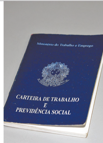
TRABALHO - Caged mostra evolução do emprego na região de Lençóis