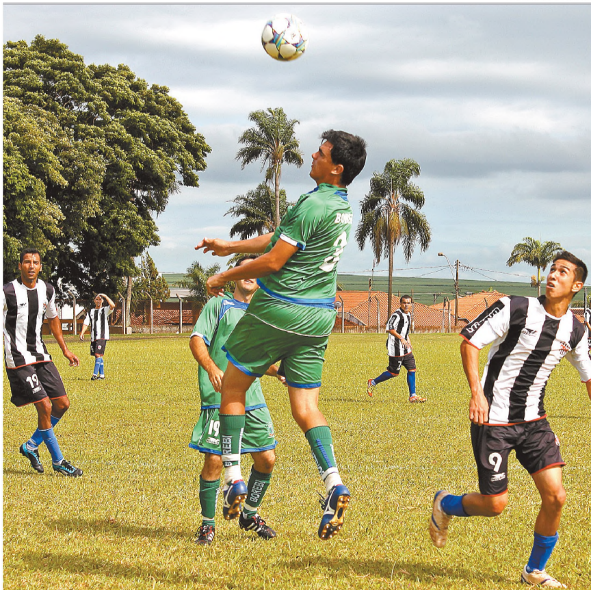
CABEÇADA - Jogador do Borebi (verde) disputa bola aérea com o Atlético Macatuba