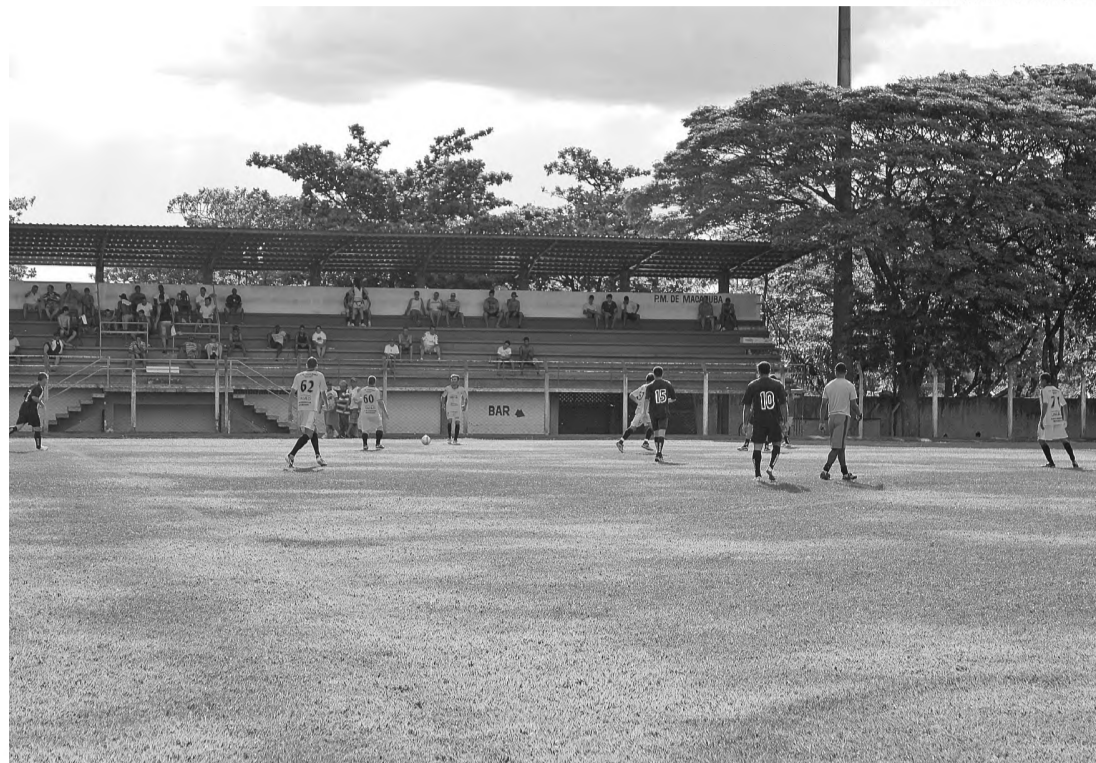
PALCO – Liga Lençoense de Futebol Amador auxiliará na organização de campeonatos no estádio Amadeu Artioli