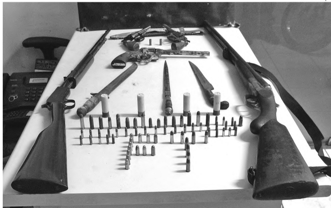
VARIEDADE – Pequeno arsenal foi apreendido pela Força Tática; armas que pertenciam a idoso seriam furtadas por criminosos

No sítio do acusado, localizado no bairro rural de Fartura, foram encontrados ainda uma Winchester calibre 22 e uma espingarda cartucheira inglesa calibre 20. Os policiais se dirigiram