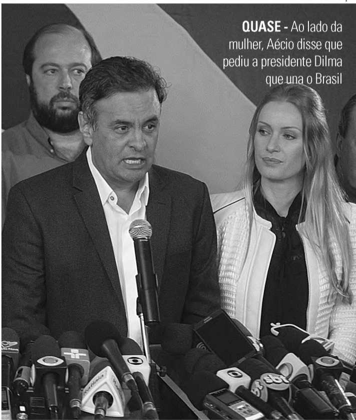
QUASE - Ao lado da mulher, Aécio disse que pediu a presidente Dilma que una o Brasil

Derrotado em uma campanha duríssima e cheia de altos e baixos, o candidato do PSDB, Aécio Neves, se despede da disputa eleitoral de 2014 agradecendo a São Paulo pelo número de votos. No Estado, Aécio teve 64,31% dos votos contra 35,69% de Dilma Rousseff. Apesar da derrota, todos os comentaristas políticos apontaram para um fortalecimento da oposição capitaneado pelos 50 milhões de votos obtidos pelo tucano.