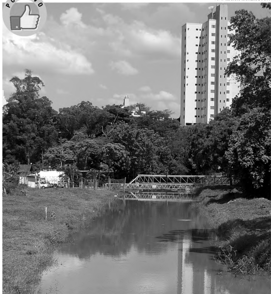
RIO LENÇÓIS - Enfima estiagem deu uma trégua e a chuva do último final de semana foi muito bem-vinda. O Rio Lençóis ficou um mais cheio e vivo. Segundo os meteorologistas, o mês de novembro promete chuvas mais frequentes. O planeta agradece!