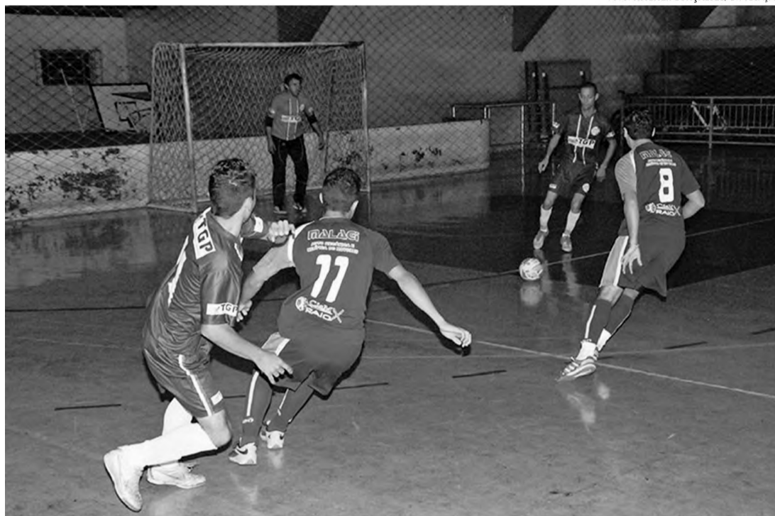
NA BRIGA - Democrata, que já venceu a Copa Regional Cidade do Livro, tenta mais um título no salão em 2014

faturou o título da Copa Cidade do Livro este ano, enfrenta o Nova Lençóis de olho em outra decisão no salão. Na partida seguinte, às 20h50, quem entra em quadra são as equipes do São Cristóvão e do Infinity.