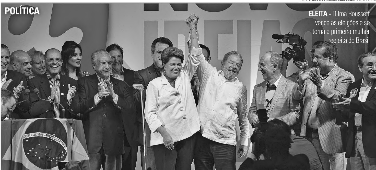
ELEITA - Dilma Rousseff vence as eleições e se torna a primeira mulher reeleita do Brasil