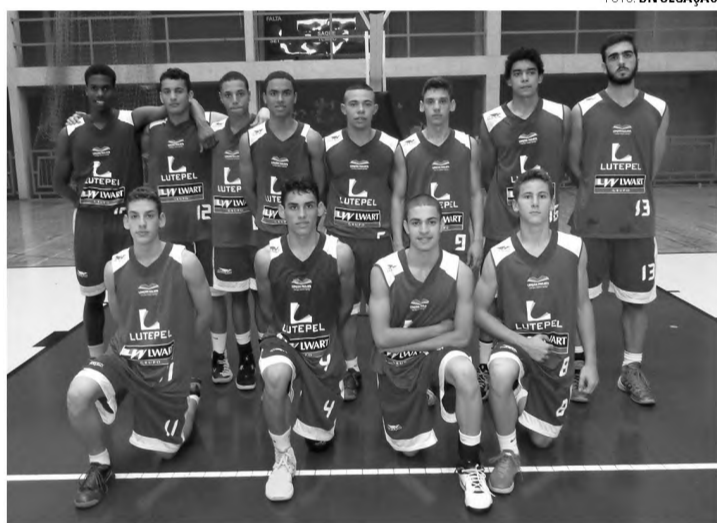
MAIS UMA - Sub 17 vence quinta consecutiva e garante vaga nas finais

A equipe sub-17 masculina do Alba viajou para São Caetano do Sul no último sábado para enfrentar os donos da casa pelo Campeonato Paulista da categoria, promovido pela Federação Paulista de Basketball (FPB). O confronto, válido pela primeira partida do retorno dos playoffs da série prata, terminou com uma vitória de 83 a 68 para o time lençoense, que já estava na liderança absoluta da competição, com quatro vitórias em