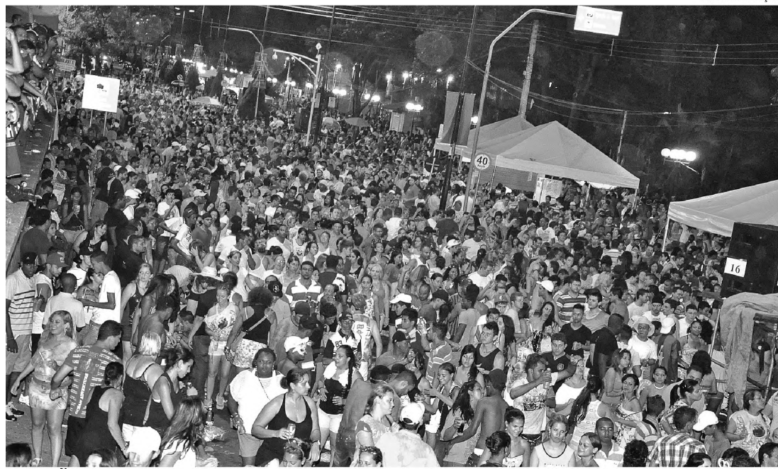
LOTAÇÃO – Avenida Pedro Ometto ficou cheia de foliões durante os quatro dias de festa