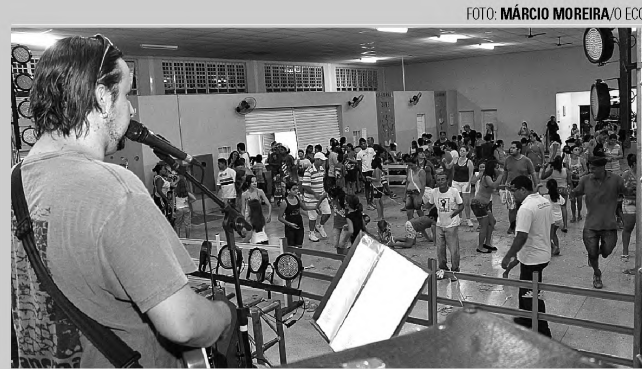
SUCESSO – Novo formato levou Carnaval para bairros; foto mostra baile no Centro de Convivência da Melhor Idade, na Cecap

Nos eventos, não foi registrada nenhuma ocorrência policial