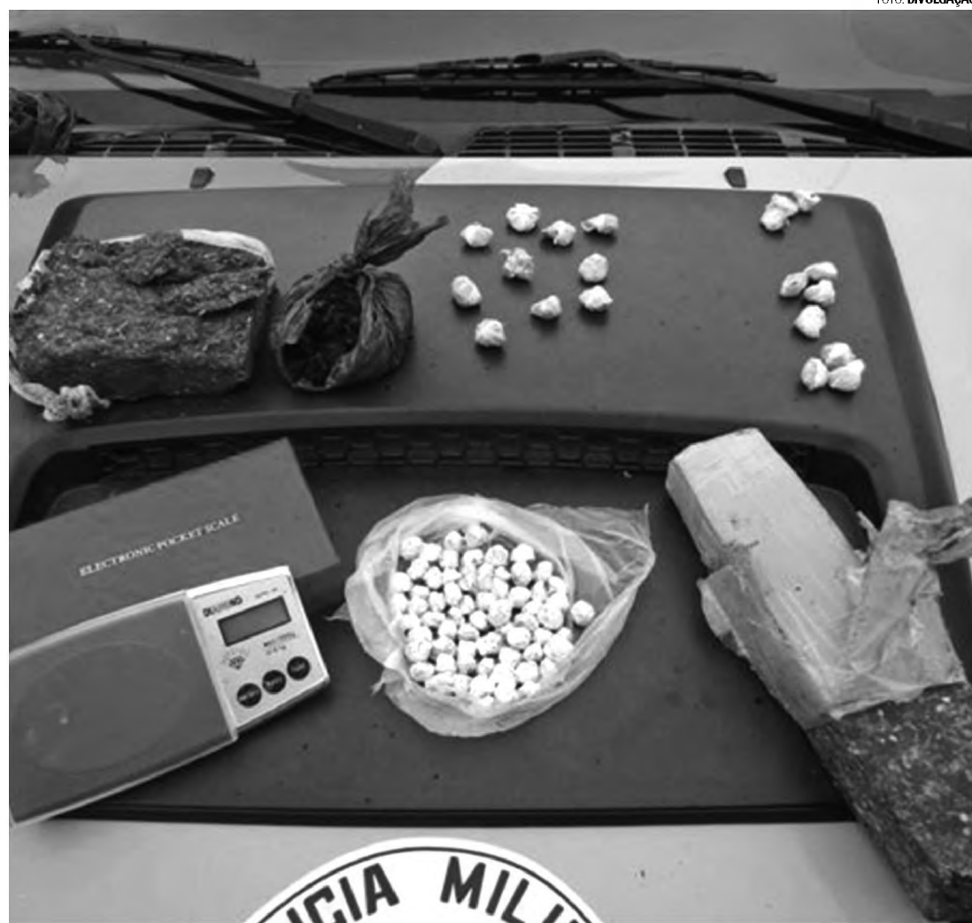
TIJOLO – Droga apreendida durante operação "Saturação", realizada pela Força Tática em Agudos

A comandante contou que em Lençóis Paulista grande parte das ocorrências envolvendo menores está relacionada ao tráfico e porte de entorpecentes. Em 2011, a PM registrou 84 ocorrências, contra 126 registros no ano passado. Para coibir os roubos, a tenente disse que a Polícia Militar faz planejamento