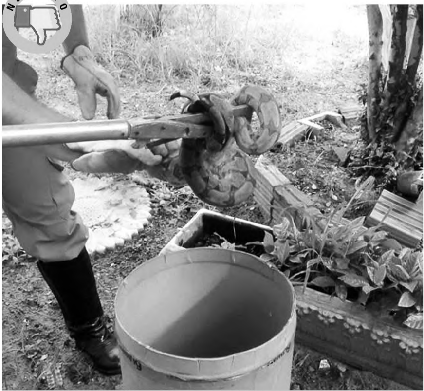
AGUDOS - Uma jiboia com cerca de dois metros foi capturada em uma residência do Centro de Agudos na manhã do último domingo. Depois de notar a presença do animal, os moradores acionaram o Corpo de Bombeiros, que capturou o animal em uma das árvores do quintal da casa e depois o liberaram na mata. A espécie não é peçonhenta e se alimenta de roedores.