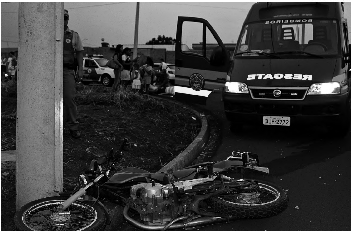
DUAS RODAS - Dados da Secretária de Segurança Pública indicam maior número de acidentes em Lençóis Paulista envolveu motocicletas

Foi o segundo registro envolvendo bicicleta e menor de idade em oito dias; 17 pessoas morreram vitimadas por acidentes em Lençóis Paulista nos últimos 26 meses, segundo registros da SSP