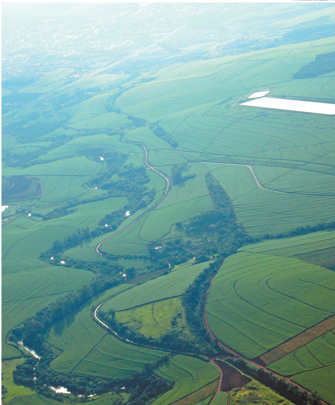
MAR VERDE - Imagem aérea da região do Lageado mostra rio Lençóis e plantação de cana; acima, a Estação de Tratamento de Esgoto