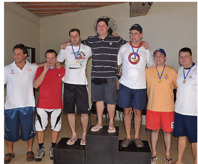
PÓDIO - Equipe campeã do campeonato interno de Biribol do CEM

No sábado 23, encerrou o campeonato interno de Biribol do CEM, evento que foi disputado em 4 etapas e teve a participação de seis equipes. A semifinal e final tiveram bom público prestigiando.