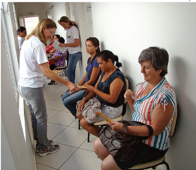
INFORMAÇÃO - Ação inclui orientações a pacientes das UBSs

Junto com a Semana da Saúde é possível realizar exame de sífilis e HIV no Ambulatório de Especialidades, ESF do Júlio Ferrari, UBS do Ubirama e ESF do Jardim Caju. O resultado sai em apenas 15 minutos e o teste é gratuito.