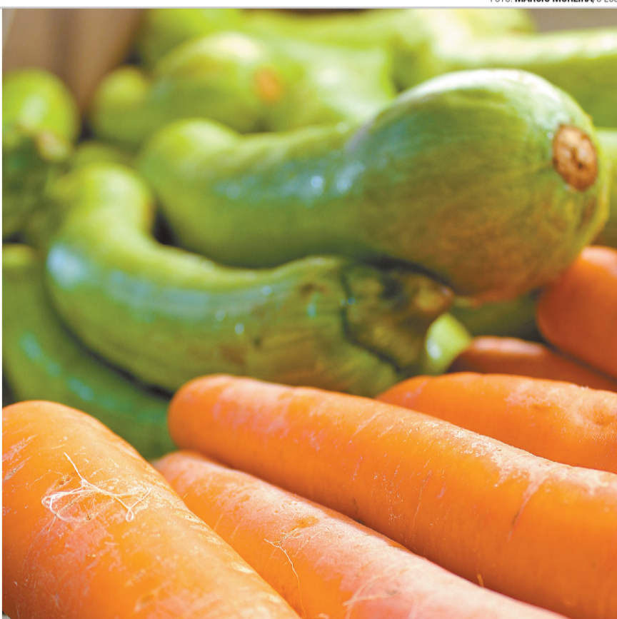
ALIMENTAÇÃO SAUDÁVEL - A falta de ingestão de ferro pode contribuir na anemia

A cerimônia de abertura da 66ª edição do JOS (Jogos do Sesi) e a 3ª edição do JOCI (Jogos do Comércio de da Indústria) de Lençóis Paulista será no ginásio Antônio Lorenzetti Filho, o Tonicão, a partir das 19h30, e está dentro da programação oficial pelos 155 anos de Lençóis Paulista. Entre 1 mil e 2 mil atletas devem participar das competições durante quatro meses. Neste ano, as competições reúnem atletas/colaboradores de 30 a 35 empresas para a disputa de 30 modalidades.