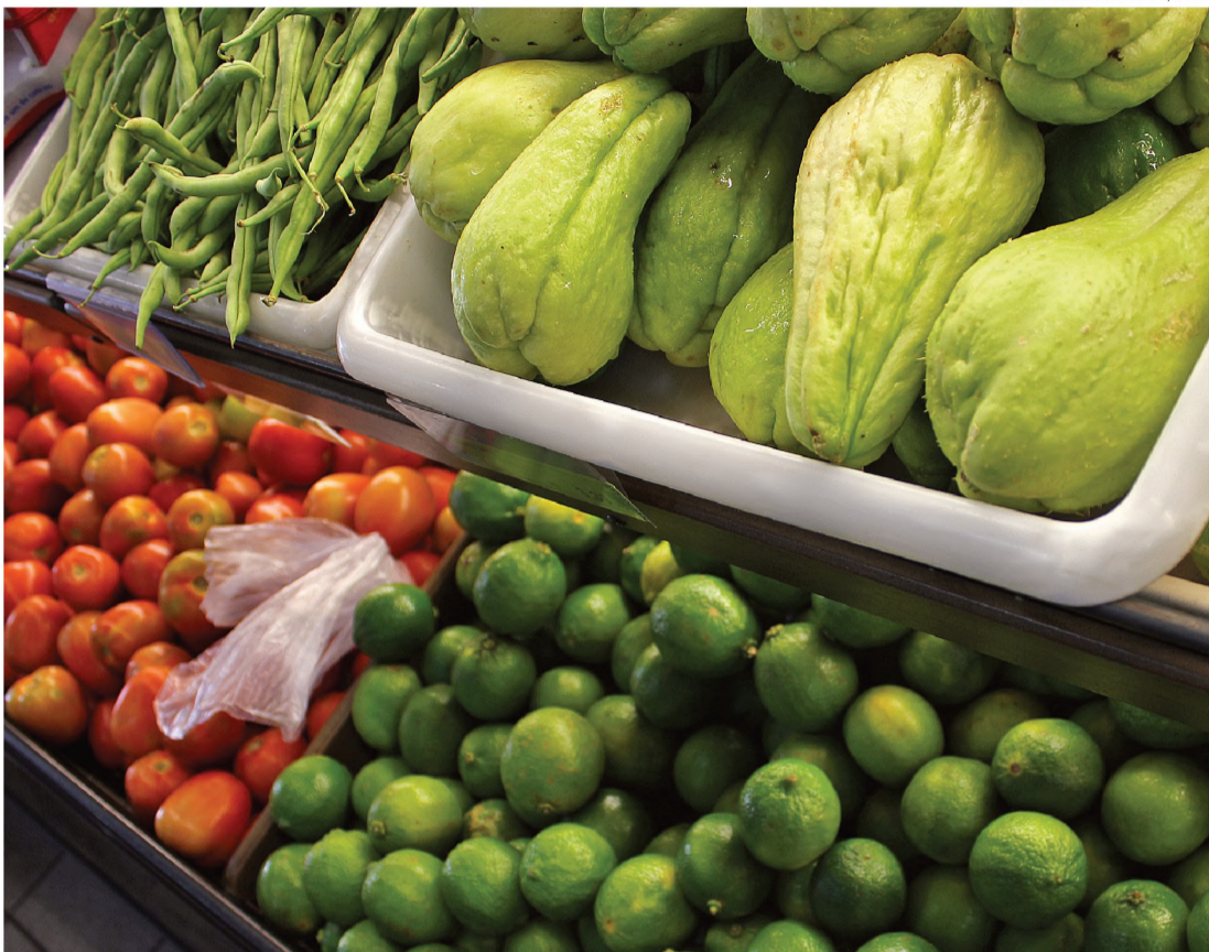
ALIMENTAÇÃO – Vegetais verdes ajudam a prevenir e tratar a anemia; ovos e leite também estão na lista

E se engana quem diz que crianças mais 'gordinhas' e que comem mais estão livres da anemia. "Crianças obesas também podem desenvolver anemia. A doença decorre da falta de alimentos ricos em ferro e não de alimentos calóricos".