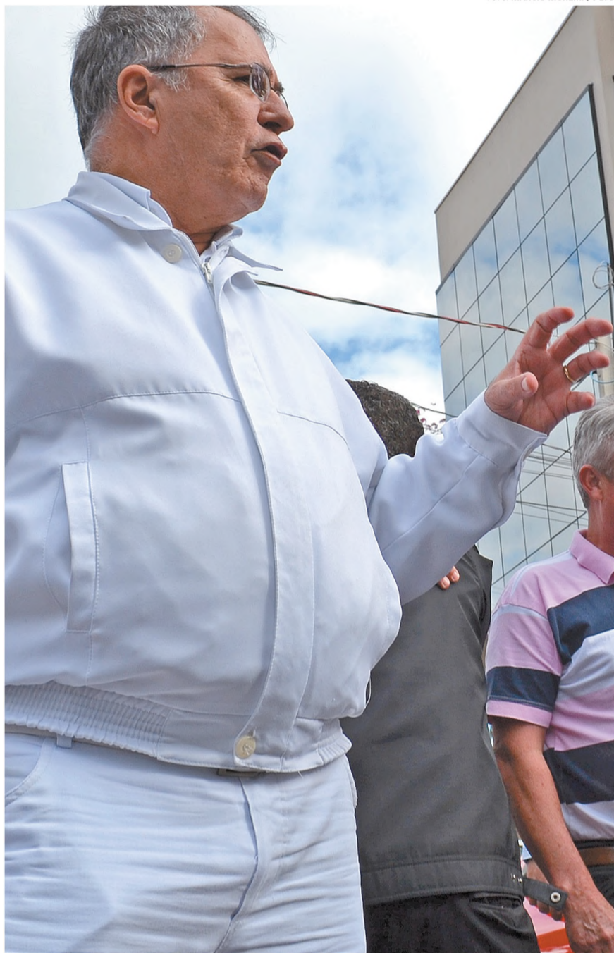
ALGUEL CARO - Presidente da Câmara, Pita em frente à nova sede do Legislativo