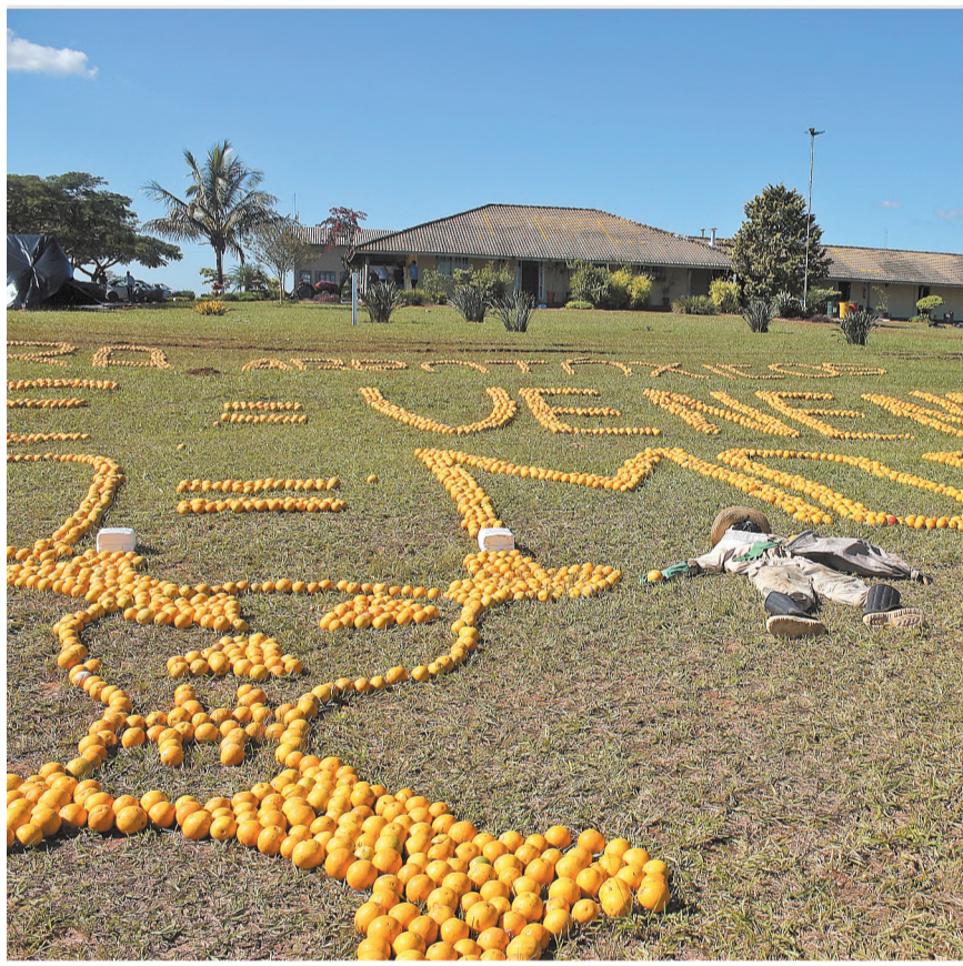
ARTISTAS - A manifestação do MST em Borebi deixou mensagens usando laranjas

O governador Geraldo Alckmin (PSDB) pode participar da inauguração da creche do Santa Terezinha. A informação, antecipada pelo jornal O ECO, foi confirmada ontem pela prefeita Bel Lorenzetti (PSDB). Ela contou que esteve na Casa Civil nesta terça-feira 4 de junho, para acertar a possível visita do governador a Lençóis Paulista, que além da creche também faria entrega do novo viaduto sobre a Rodovia Osni Matheus (SP 261) e da rotatória do Jardim Cruzeiro. A prefeita informou, ainda, que as obras deverão se entregues até o final do mês de julho. A creche do Santa Terezinha é a primeira de um conjunto de mil creches a serem construídas através do programa Creche Escola.