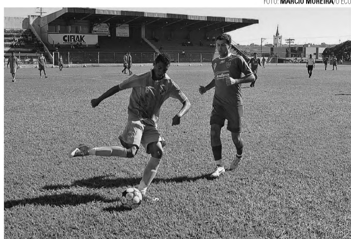
POLEMICO – Palestra empatou com o Maringá em jogo marcado por confusão entre arbitragem e jogadores