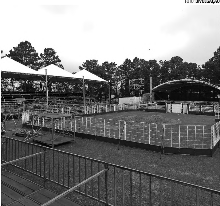
ARENA EM PÉ - Estrutura está sendo erguida para receber a festa

Ontem, dezenas de pessoas trabalhavam na preparação do recinto que tem nova disposição entre a arena de rodeio e par-