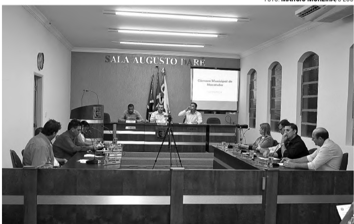
COLETA DE DADOS - Vereadores querem um levantamento de informações sobre o atual sistema de água e esgoto de Macatuba

cardo Genovez (PV), pretende levantar dados do sistema de água e esgoto para que o município possa direcionar suas ações no impasse entre a volta da Sabesp ou a permanência da Enops En-