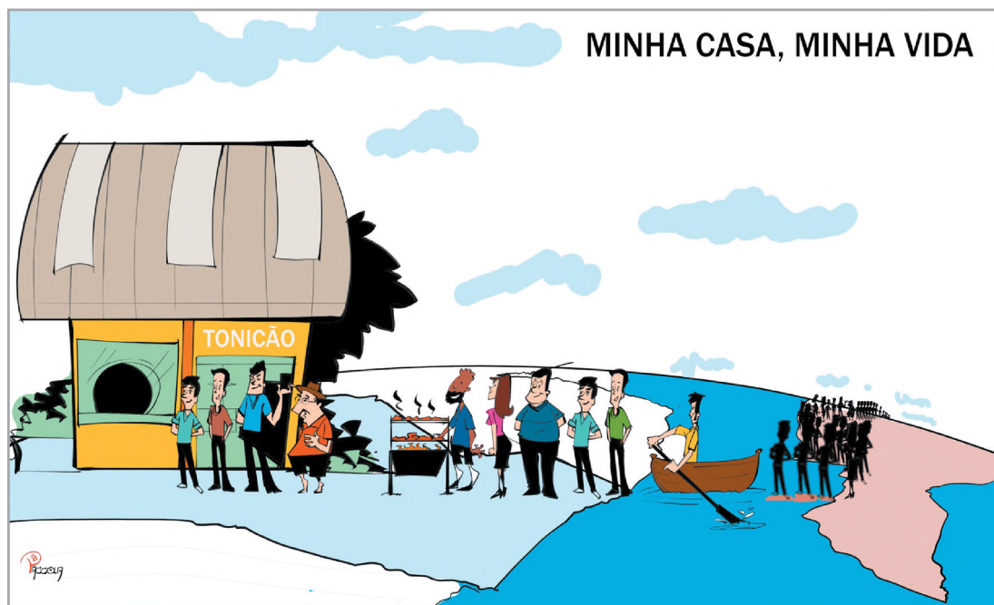
MINHA CASA, MINHA VIDA