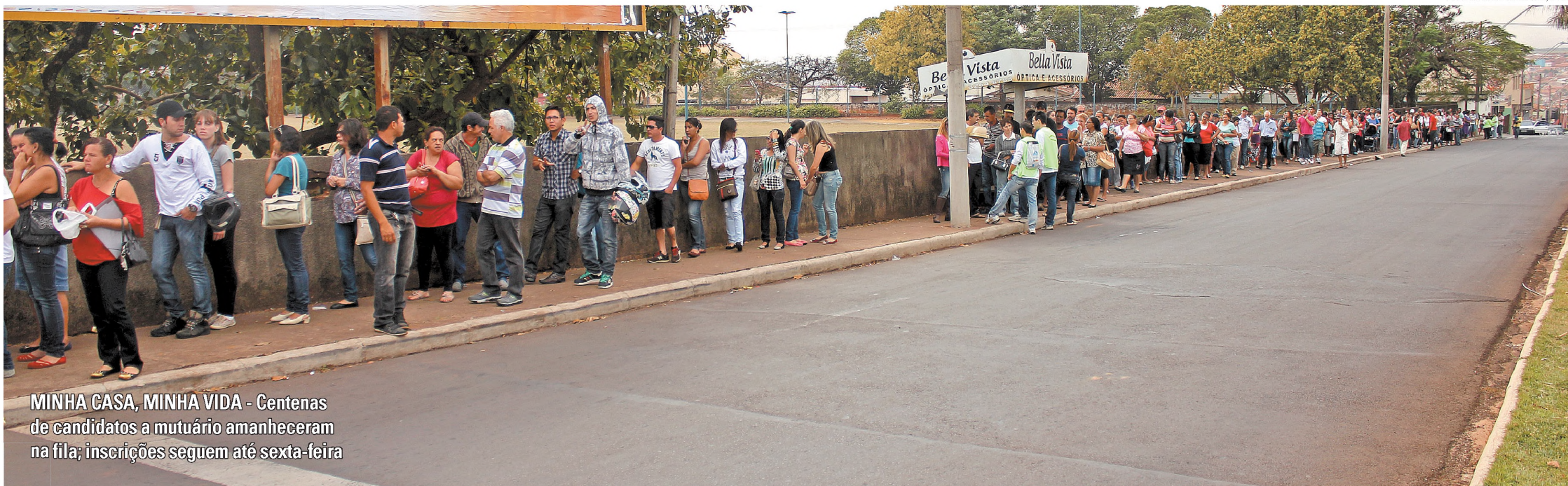
MINHA CASA, MINHA VIDA - Centenas de candidatos a mutuírio amanheceram na fila; inscrições seguem até sexta-feira