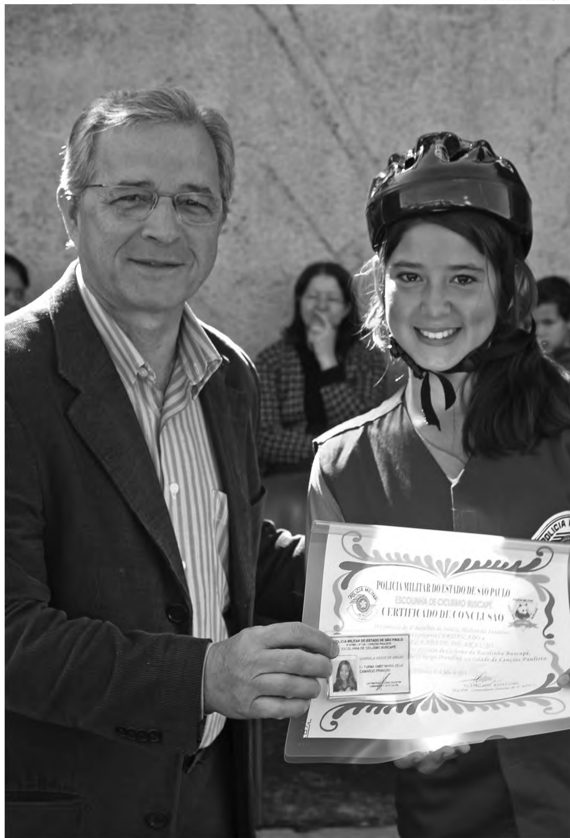
DIPLOMADOS – Alunos receberam certificado de conclusão da Escolinha de Ciclismo Buscapé; na foto, uma das turmas recebe o documento em julho, no bairro Júlio Ferrari

O projeto teve início em julho, com a participação dos alunos da Escola Municipal Maria Zélia Camargo Prandini (Conjunto Maestro Júlio Ferrari).