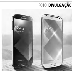
No rastro da Apple, A fabricante sul-coreana Samsung apresentou nesta quarta-feira duas versões douradas de seu principal smartphone, o Galaxy S4