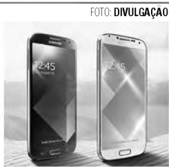
No rastro da Apple, A fabricante sul-coreana Samsung apresentou nesta quarta-feira duas versões douradas de seu principal smartphone, o Galaxy S4