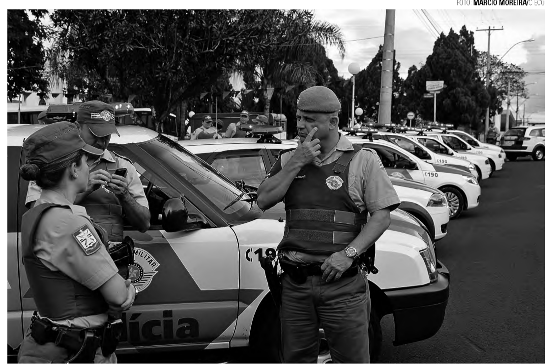
NOVIDADE — O orçamento de 2014 já prevê recursos para atividade delegada; valor destinado será de R$ 100 mil

A peça orçamentária de 2014 será apresentada hoje à noite, em audiência pública no Centro Municipal de Formação Profissional, a partir das 19h30. O diretor adiantou que a única novidade do orçamento