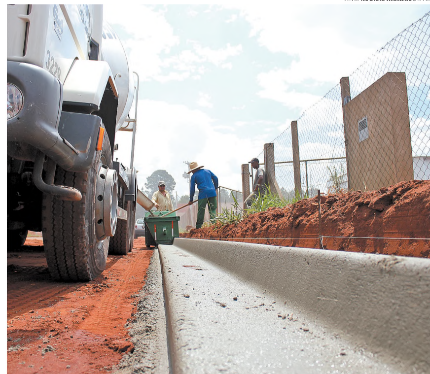
EM OBRAS - Começou nesta semana a primeira etapa das obras para a pavimentação e implantação de guias e sarjetas no Distrito Empresarial Luiz Trecenti. Os investimentos somam R$ 440,6 mil e as obras vão ser realizadas em trechos das ruas Oceania, José Brandi, Julio Andreoli, Projetada I e dispositivo de acesso.

tamento de Estradas de Rodagem), Clodoaldo Pelissioni, e pediu ajuda do Estado para recuperar o ponto de ônibus intermunicipal. Ontem, o prefeito de Macatuba disse à reportagem de O ECO que está na expectativa da liberação dos recursos. Explicou que fez o pedido pessoalmente no último fim de semana, durante visita do governador Geraldo Alckmin (PSDB) à região.