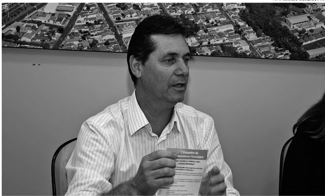
MICRO EMPREENDEDOR – Segundo Rocinha, condomínio empresarial deve ser licitado ainda este ano

Em agosto, o governador Geraldo Alckmin (PSDB) esteve em Lençóis e anunciou a liberação de R$ 500 mil para a construção do condomínio, a pedido da prefeita Bel Lorenzetti (PSDB). Todos os documentos exigidos pelo