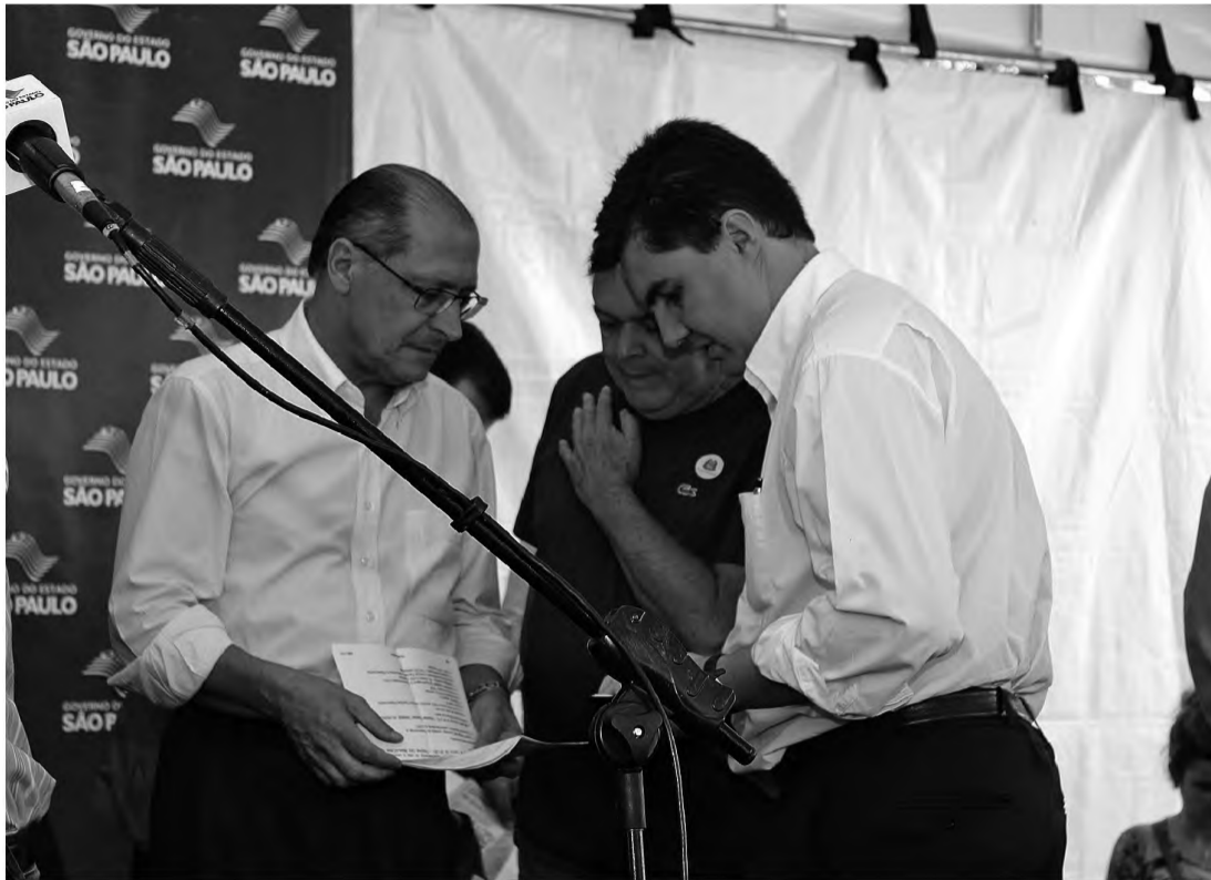
PEDIDO – Após evento com Geraldo Alckmin, Tarcísio esteve em São Paulo e pediu R$ 500 mil para rodoviária

tão de lembrar que houve um atraso para reivindicar mudanças no trecho. "Você faz um projeto executivo e precisa segui-lo. Se ele for modificado