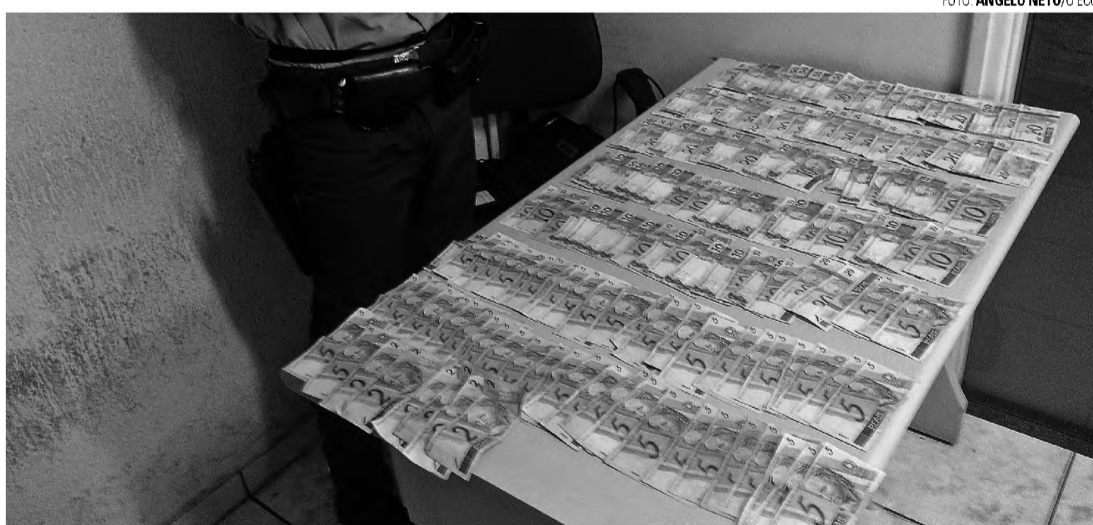
SUSPEITA – Jovens são apreendidos com drogas e mais de R$ 2 mil em dinheiro; polícia suspeita de assalto

Ao perceber a aproximação dos policiais, o grupo tentou fugir e dispensou uma sacola com o dinheiro. A polícia conseguiu detê-los e durante a abordagem os policiais encontraram 54 gramas de ma-