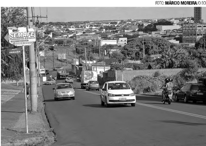
DADOS - Números de casos de lesão corporal culposa por acidente de trânsito aumentaram 57% neste ano, mostram dados da Secretaria de Segurança

No mês de setembro, foram registrados dois roubos, o menor número deste ano