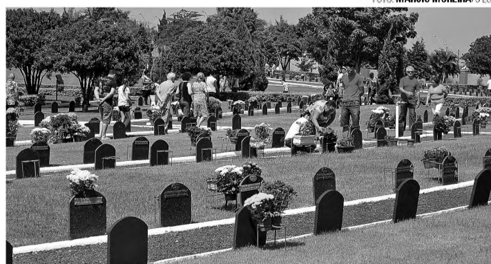
SAUDADES – Finados reuniu familiares e amigos nos cemitérios

O feriado de Finados, 2 de novembro, levou cerca de 8 mil pessoas aos dois cemitérios de Lençóis Paulista. No cemitério Paraíso da Colina, aproximadamente 3 mil pessoas visitaram os jazigos, número considerado baixo, comparando aos anos anteriores. Os horários com maior movimento foi entre 9h e 11h e