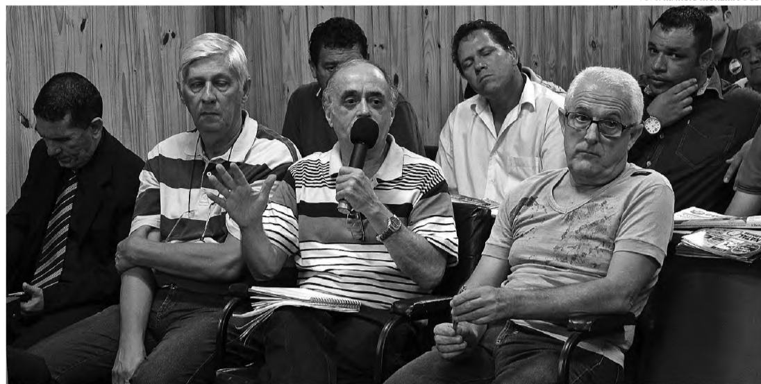
NOVA CEI – Câmara abre nova CEI para investigar denúncias de mau atendimento no Hospital de Agudos

O relatório dos contadores trouxe informações sobre os documentos fornecidos pelo Hospital no período de janeiro a dezembro de 2012, ano em que a Prefeitura de Agudos fez repasses que, juntos, somavam R$ 4.394.450,00. Neste período, a entidade fechou o ano com déficit de R$ 415.582,30.