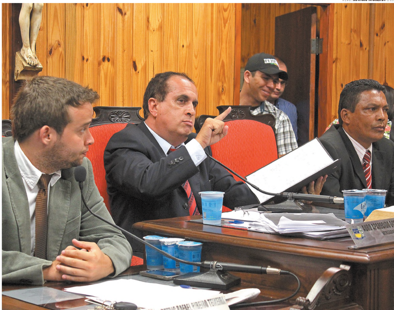
SOB PRESSÃO - Vereadores cobraram mudanças na administração do Hospital de Agudos; diretoria se reúne esta semana