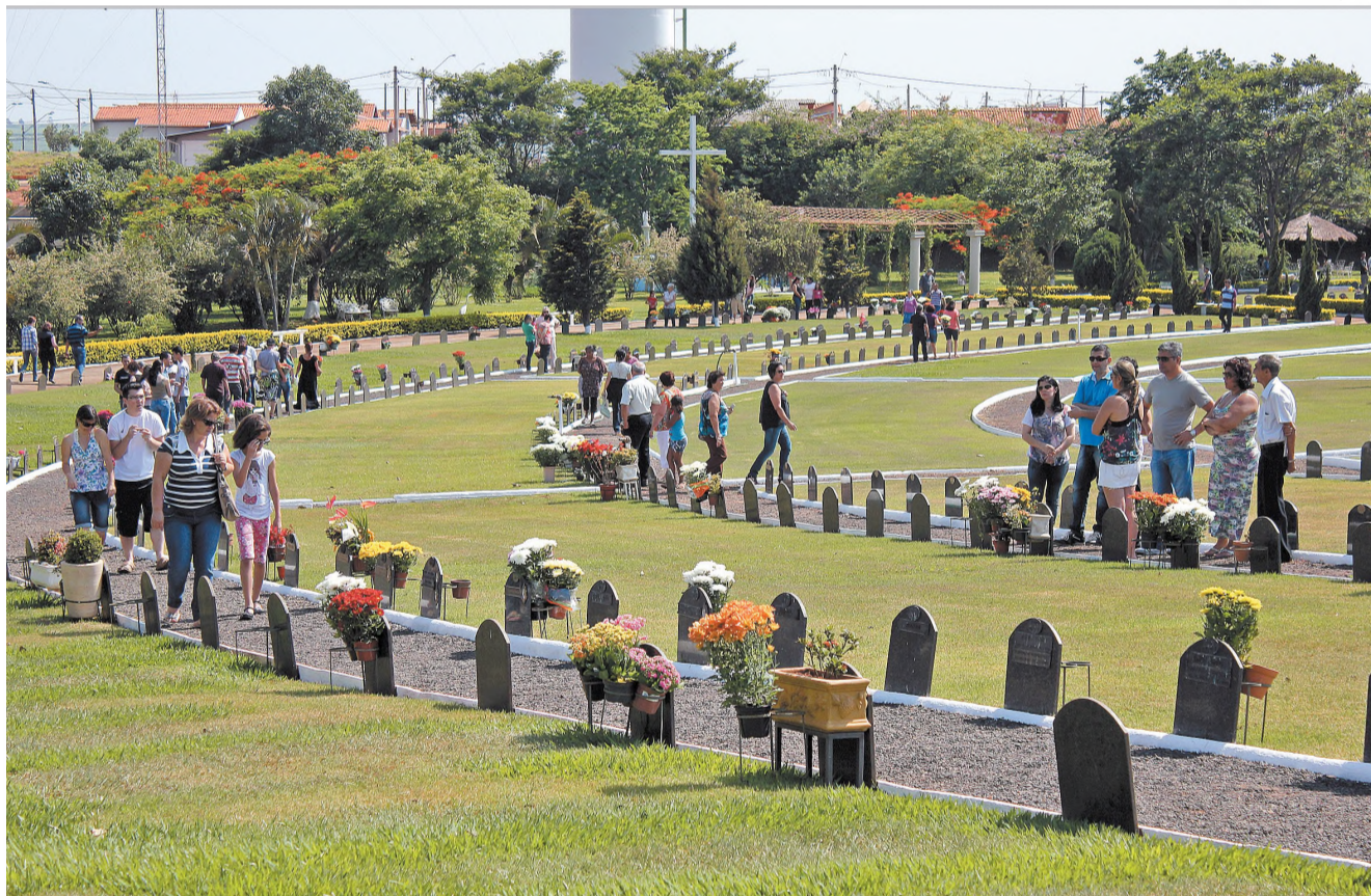
DESCANSO ETERNO - Parentes e amigos visitaram túmulos de entes queridos nos cemitérios de Lençóis Paulista e região