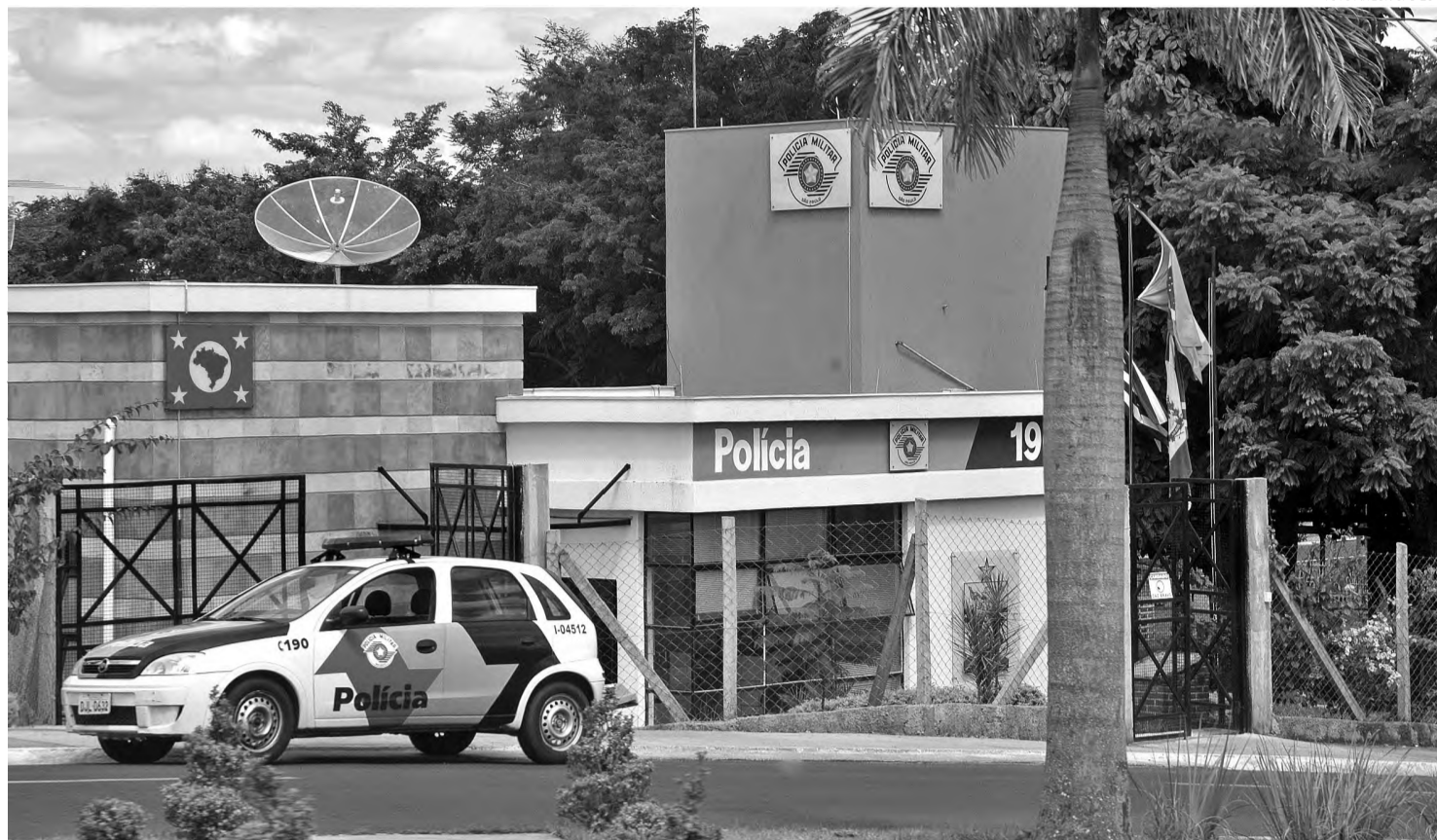
REFORÇO – Atividade Delegada reforçará segurança em Agudos a partir de dezembro

nico feito por câmeras nas principais ruas da cidade vai receber melhorias e poderá ser gerenciado pelos policiais em função delegada. Problemas em câmeras de monitoramento já foram identificados e so-