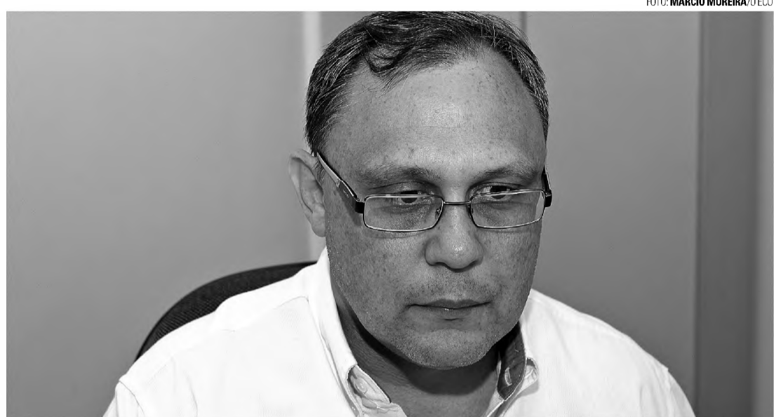
CHAVE DO COFRE - Não temos receita que faça frente a essas novas despesas, diz diretor de Finanças

Durante a sessão de segunda-feira 25, alguns vereadores utilizaram a palavra livre para