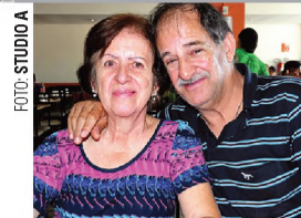
Ambiente Marina e Generoso, Tempeiro Caseiro