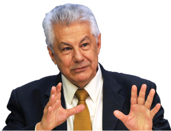
ARTICULAÇÃO - Arlindo Chinaglia e Eduardo Cunha buscam votos para a eleição da presidência da Câmara Federal

despesas com a atividade parlamentar, como telefone, passagens, consultorias, divulgação, entre outras. Hoje, essa verba varia de R$ 27 mil a R$ 41 mil, dependendo do Estado do congressista. Ele promete "mudar a metodologia de compra de passagens aéreas para otimizar a utilização desses recursos".