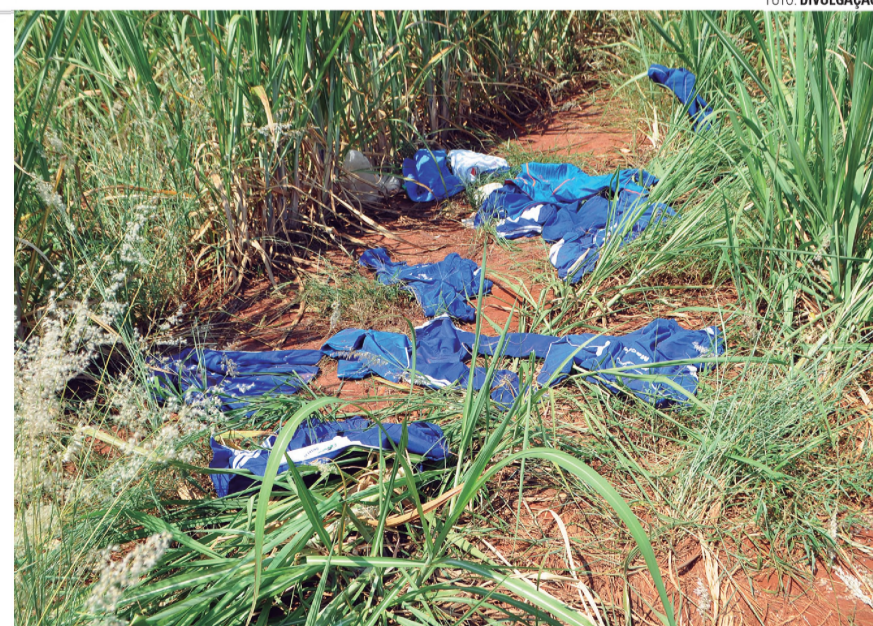
IRREGULAR - Uniformes e roupas foram encontradas jogadas em Macatuba

da Prefeitura foram ao local checar o problema e constataram que havia uniformes escolares das redes públicas de Macatuba, Lençóis Paulista, Pederneiras e São Paulo, além de uniformes profissionais de empresas privadas, de uma escola particular e peças de roupas comuns. O material foi recolhido e está sob guarda da Prefeitura, à disposição da Polícia Civil, que já investiga o caso.