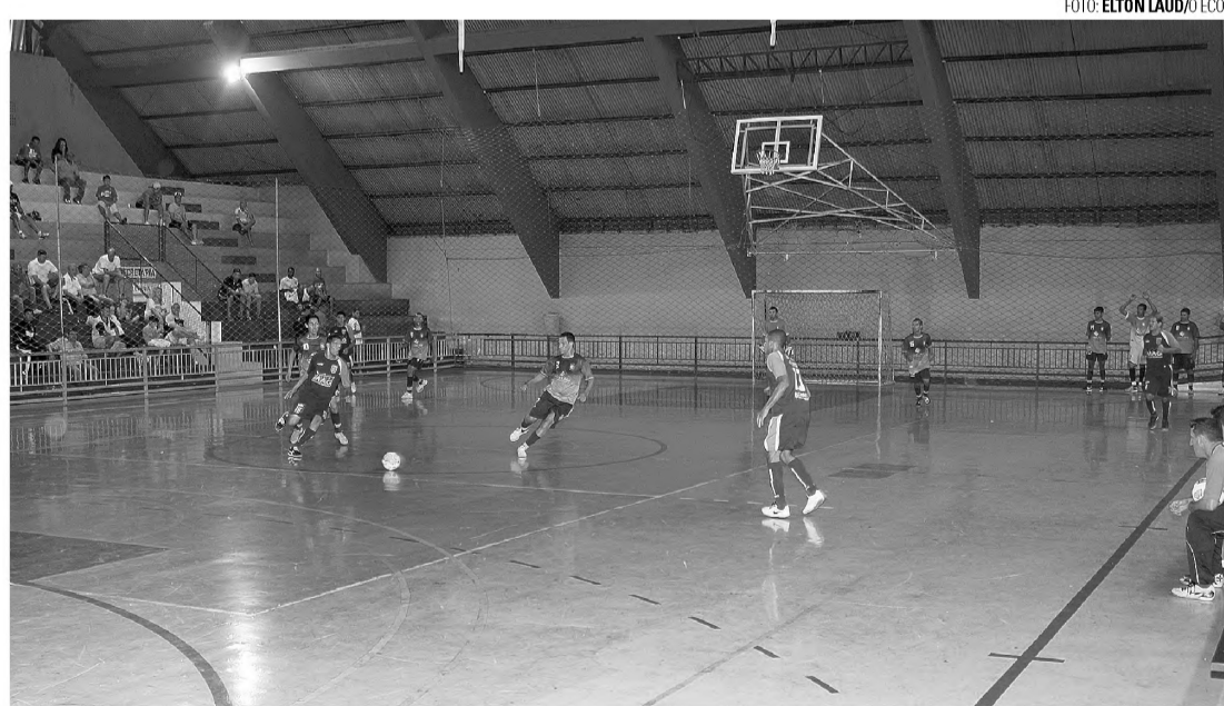
OSSO DURO - Democratas (calção e camisa escuros), atual campeão, está entre os grandes favoritos ao título

O atual campeão da competição é o Democratas, que na decisão do ano passado derrotou Borebi por 4 a 2.