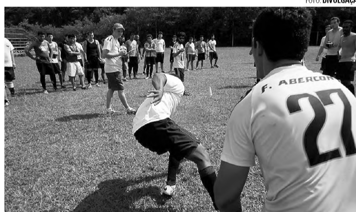
ATENÇÃO - Técnico do Readers observa candidatos na seletiva de sábado

Com boas perspectivas para a temporada 2015, a equipe de futebol americano da cidade, formada no início do ano passado por atletas de Lençóis e Bauru, se reuniu na tarde de sá-