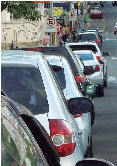
FILA - Sem vaga para estacionar, motoristas circulam pelo Centro da cidade