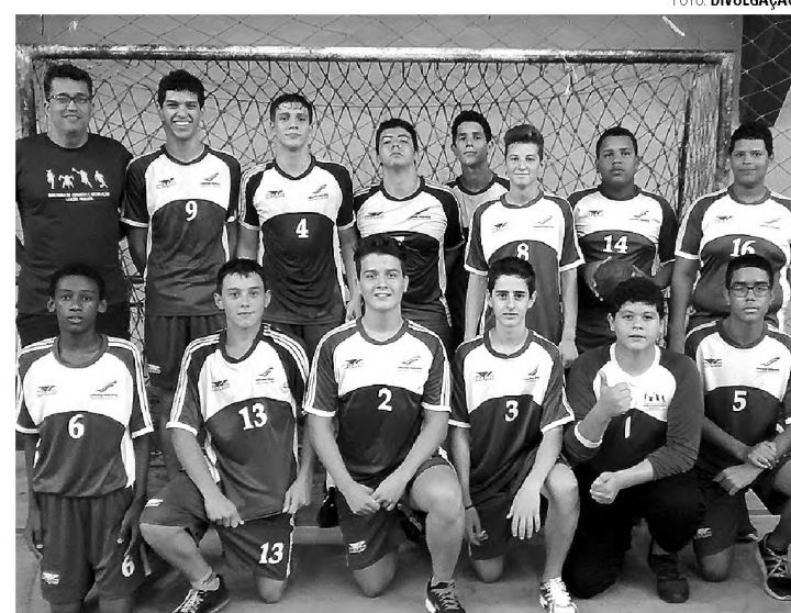
EM CASA - Equipes posam juntas para foto depois de vitórias pela Liga

A equipe mirim apenas fez a sua estreia na competição e mostrou que também tem