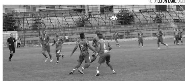
TRANQUILO - Com marcação forte, G. Cecap deu pouco espaço ao Asa

Após um mês de disputa, a 10ª Copa Lençóis de Futebol Amador - Troféu Armando Orsi, vive momentos decisivos. Na rodada do último domingo, no estádio Archangelo Brega, o Bregão, quatro equipes entraram em campo para a disputa dos dois primeiros confrontos da terceira fase, de onde saem os semifinalistas da competição. O Grêmio Cecap mostrou sua superioridade diante do Asa Branca e com uma goleada de 6 a 1 já se garantiu sem a ne-