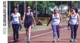
Corrida Solidária Pessoal caminhando em prol das famílias das enchentes