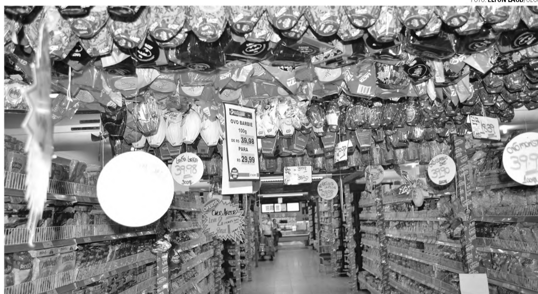
QUEIMA DE ESTOQUE - Supermercados oferecem descontos de até 50% para acabar com os ovos de páscoa

quia especializada, comenta que depois de uma excelente páscoa em 2015, já esperava uma baixa nas vendas, mas o resultado assustou bastante, com queda de cerca de 90% nas vendas. "Por conta da crise, muitas pessoas decidiram não comprar ovo de páscoa este ano e muitas acabaram optando por opções mais em conta. Vendemos mais os ovos menores. Outro fator que pesa é que muitas pessoas estão fazendo ovos em casa e vendendo bem mais barato porque não têm gastos com impostos e os tributos que pagamos no comércio. Tudo isso interfere", avalia.