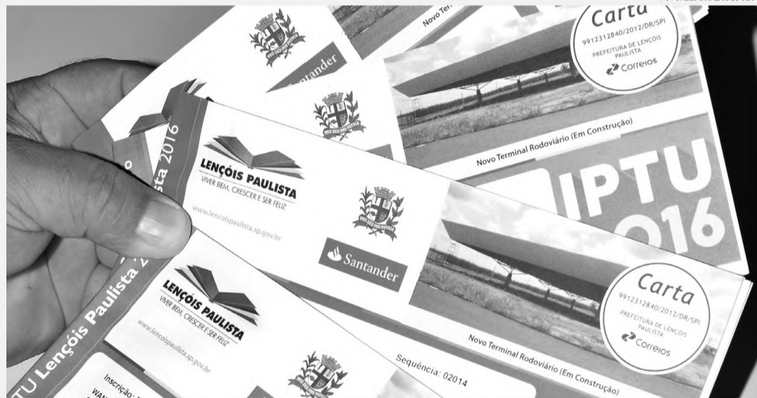
CARNÊS - Fique atento para não perder data do pagamento da primeira parcela ou cota única do IPTU

O tributo também pode ser pago em três vezes, com vencimento nos dias 15 de abril, 15 de maio e 15 de junho. Neste caso, o contribuinte também recebe o desconto de 20%. O IPTU e ISS também pode ser pago em nove vezes, com o primeiro vencimento no dia 15 de abril. Neste caso o valor não tem desconto.