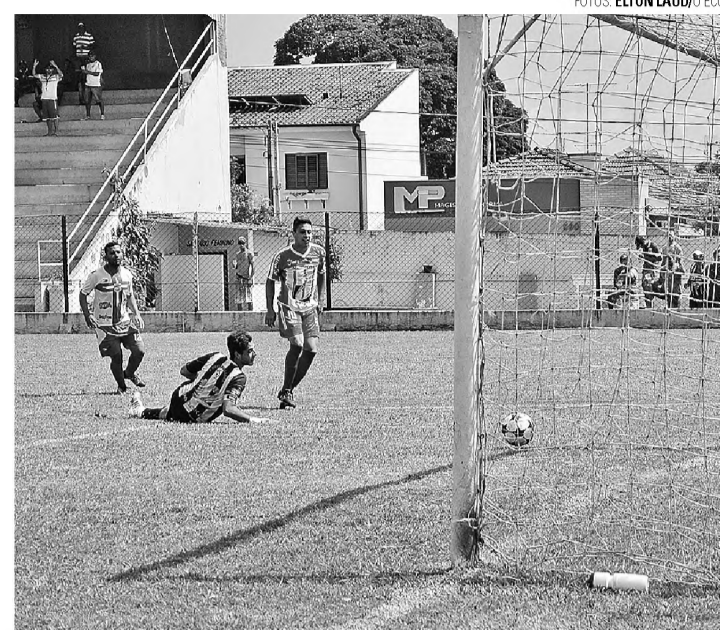
QUASE - Atual campeão, Expressinho sofre, mas vence Nova Lençóis de virada e está na semifinal

que se enfrentam no Bregão, a partir das 9h30. Na semana seguinte, no dia 26, Expressinho e Alfredo Guedes brigam pela outra vaga no mesmo horário, também no Bregão. A decisão está prevista para acontecer no dia 3 de maio.