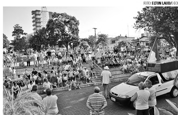
FORA DILMA - Reunidos na Concha Acústica, manifestantes expuseram suas indignações