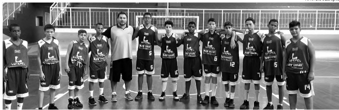
QUASE - Sub-14 da Alba perde jogo no último lance em Presidente Prudente

Jogo foi decidido no último lance; placar foi de 49 a 47 para os adversários