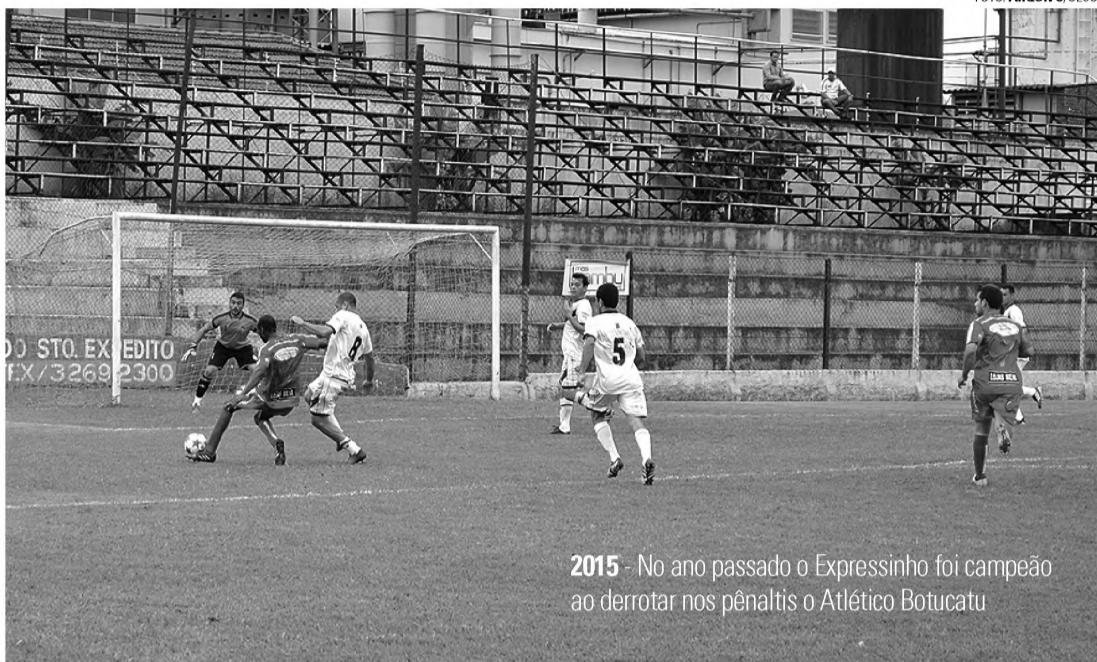
2015 - No ano passado o Expressinho foi campeão ao derrotar nos pênaltis o Atlético Botucatu

Equipes representam 11 cidades da região; Lençóis tem oito times