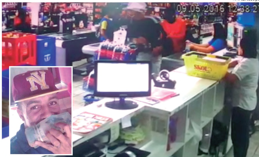
INVESTIGAÇÃO - Assaltantes durante ação em supermercado de Lençóis; no detalhe, foto retirada da página em rede social de suspeito

"Quando eu era jovem, pensava que o dinheiro era a coisa mais importante do mundo. Hoje tenho certeza.", Com esta