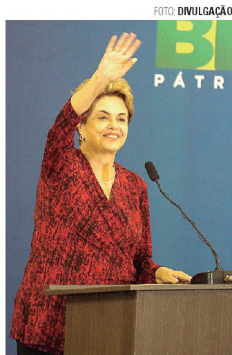
AGENDA OFICIAL - Dilma Rousseff, na entrega de novo terminal no Aeroporto Santa Geneveva

Se aprovado o parecer de Anastasia, a presidente será notificada pelo Senado de seu afastamento por 180 dias e o vice-presidente Michel Temer (PMDB) convocado a assumir o governo interinamente. Durante os seis meses do afastamento, os senadores, então dirigidos pelo presidente do Supremo Tribunal Federal, ministro Ricardo Lewandowski, processarão a presidente - ouvindo