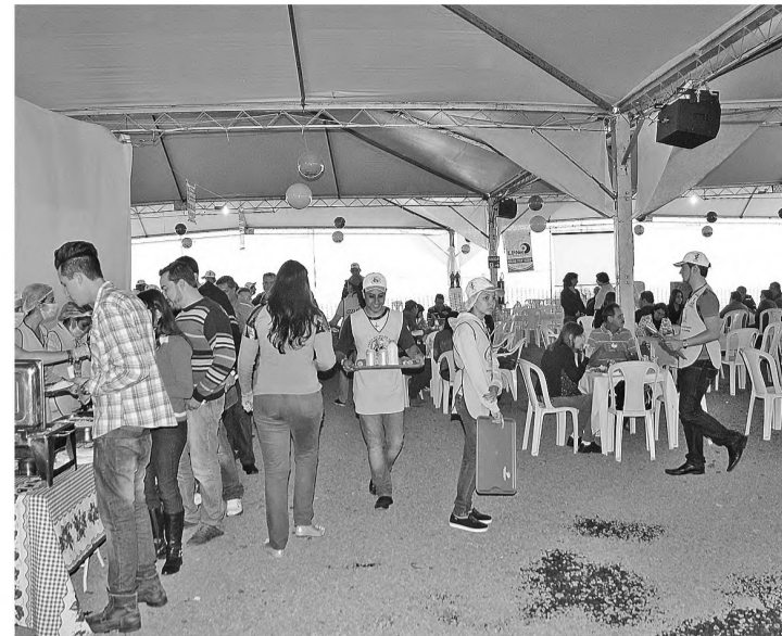
VAI COMEÇAR - Tradicional Festa do Milho Verde começa neste sábado

No dia 19, sexta-feira, às 20h, o recinto da festa recebe o show de prêmios, que terá como prêmio principal R$ 1 mil, além de diversos itens arrecadados como doação. As adesões custam R$ 10. As cartelas podem ser adquiridas antecipadamente no escritório paroquial ou no próprio local. Neste dia as barracas não estarão abertas. Mais informações podem ser obtidas pelo telefone (14) 3264-4324.