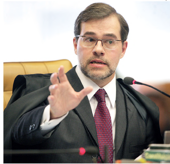
TOFFOLI - Ministro diz que eleição num só dia congestionaria o sistema

Os vereadores encaminharam para o consultor jurídico o projeto que concede aposentadoria especial aos servidores municipais que exercem funções insalubres. Havia um pedido de retirada do projeto formulado pela prefeita, mas a oposição era contrária à devolução. Por isso, através de acordo, pediu-se o parecer jurídico. Segundo os vereadores, existem problemas a resolver em relação aos trabalhadores que trabalham em dois regimes