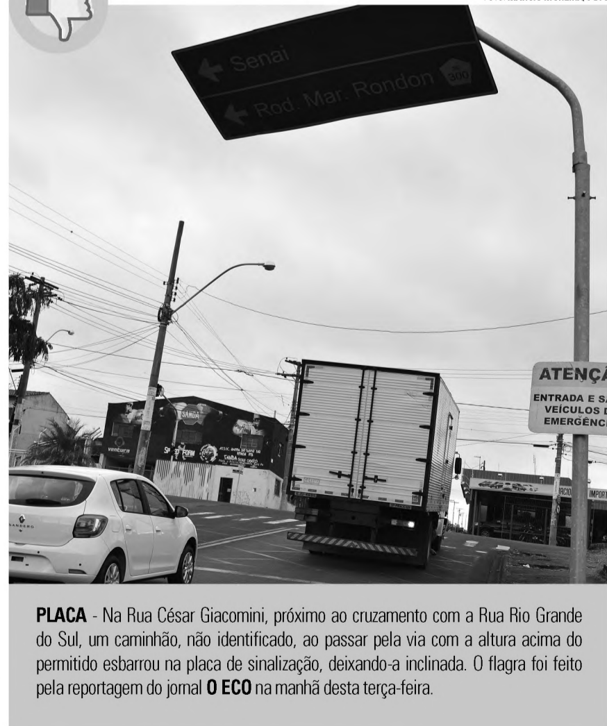
PLACA - Na Rua César Giacomini, próximo ao cruzamento com a Rua Rio Grande do Sul, um caminhão, não identificado, ao passar pela via com a altura acima do permitido esbarrou na placa de sinalização, deixando-a inclinada. O flagr foi feito pela reportagem do jornal O ECO na manhã desta terça-feira.