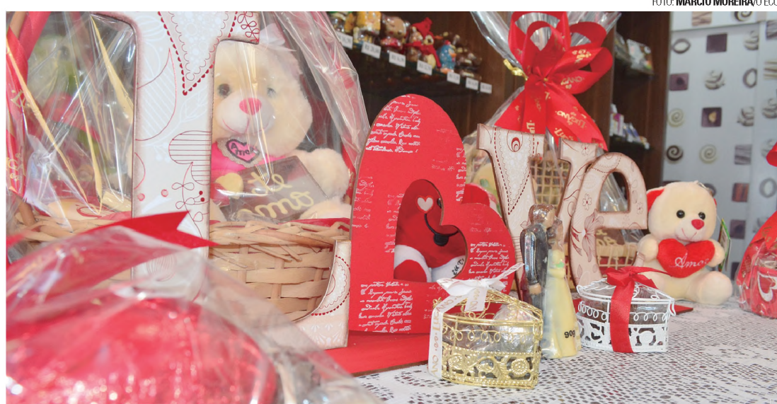
CHOCOLATE - A semana é de amor, carinho e muitos beijos. Se isso vier acompanhado de um chocolate delicioso tudo fica mais perfeito ainda. Os chocolates Lugano, direto de Gramado, é a aposta mais deliciosa e certa para faturar aquele abraço. Além de deliciosos, as embalagens têm estilo!