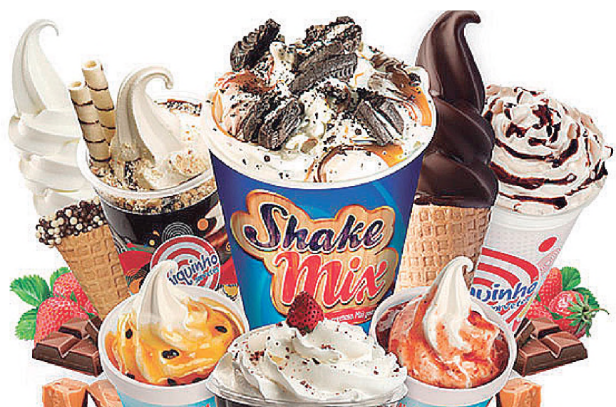
SORVETE - Apesar do frio das noites de outono, as tardes são quentes e pedem aquele sorvete delicioso que fica melhor ainda quando saboreado ao lado da pessoa amada. No Chiquinho Sorvetes, o cardápio é de deixar qualquer casal ainda mais apaixonado.