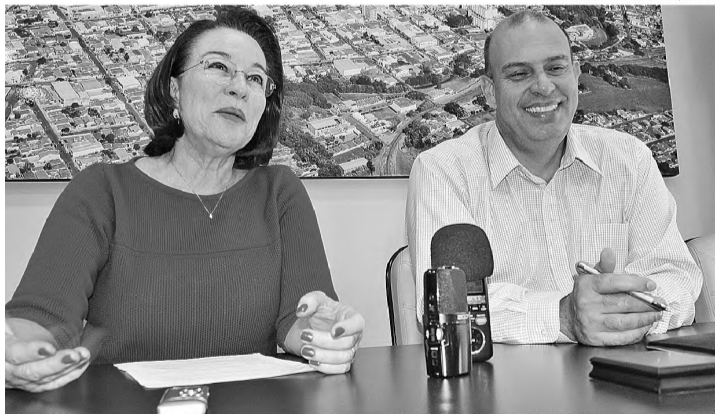
MELHORIA - Bel e Santarém devolvem à população a unidade de saúde reformada