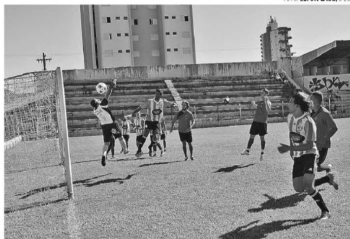
BÁSICO - Grêmio Cecap teve chance, mas ficou no empate com o Flamengo