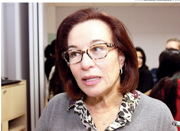
BEL - Preocupada com a baixa arrecadação no primeiro quadrimestre