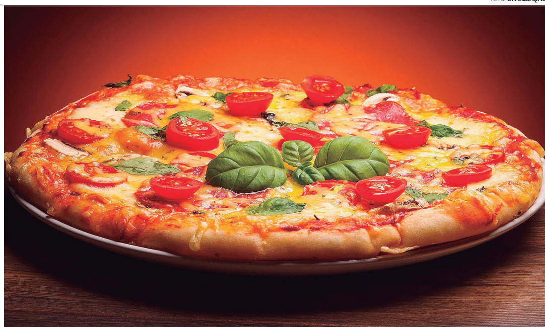
ENAMORADOS- Paixão nacional, a pizza é uma das opções para aquela noite especial

Jantar romântico é uma ótima opção para surpreender a quem se ama