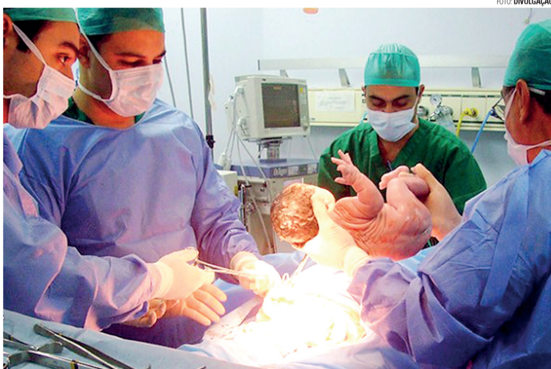
ÍNDICE ALTO - Organização Mundial da Saúde (OMS) recomenda que índice não ultrapasse a casa dos 15%

O governo busca estimular o parto normal e reduzir as cesarianas, quando possível, pois o índice de nascimentos por meio cirúrgico chega a 84,6% do total realizado via planos de saúde. O índice é extremamente alto se comparado ao recomendado pela