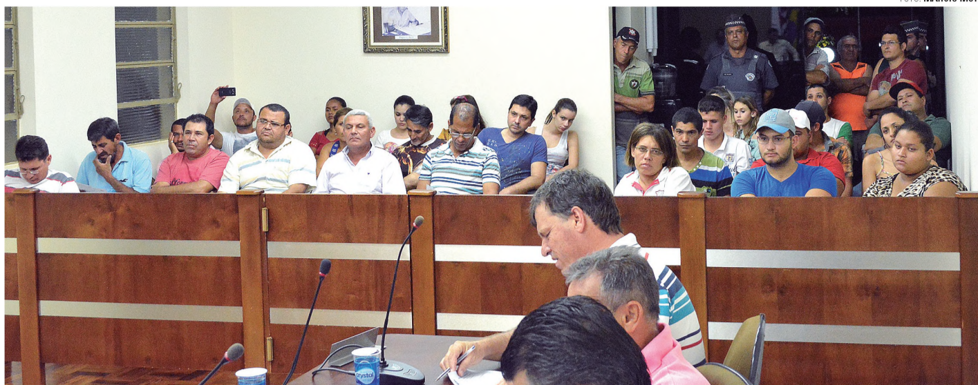
MACATUBA - Munícipes foram assistir a sessão da Câmara, mas o projeto sobre salário dos vereadores não entrou em pauta