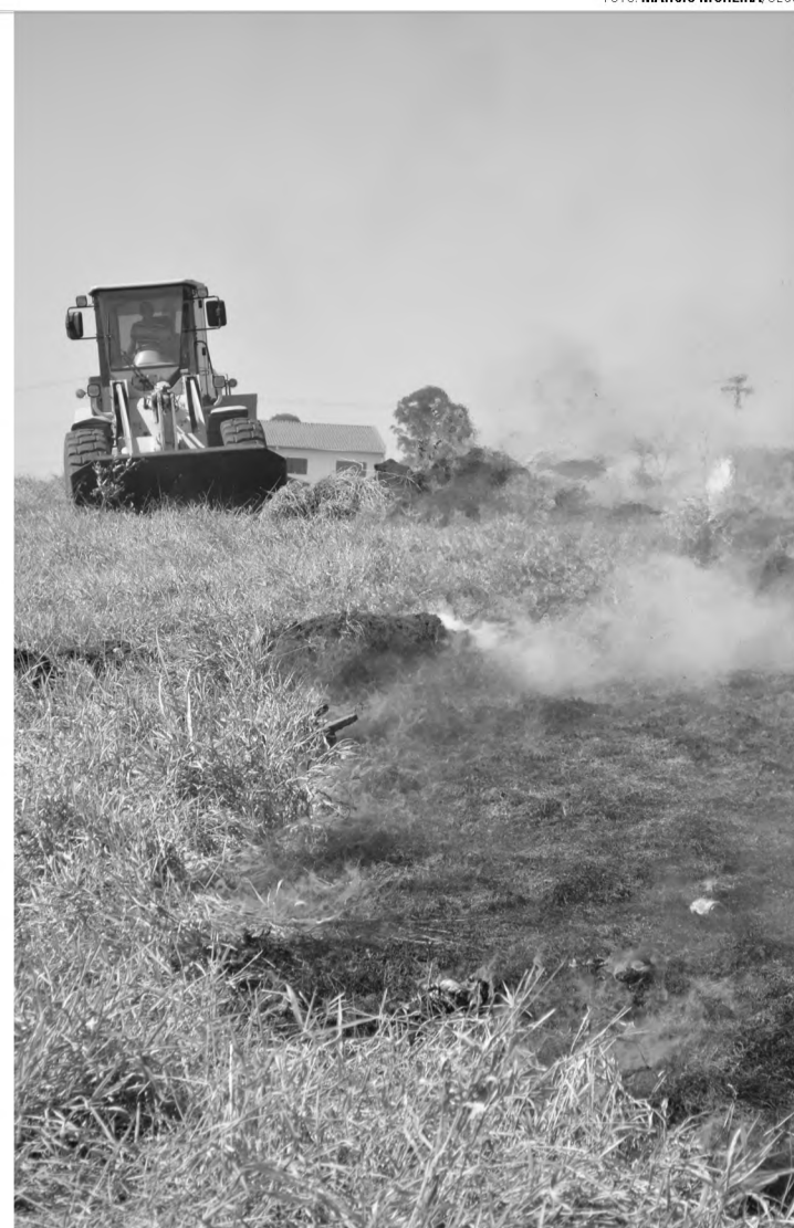
COMBATE – O incêndio no terreno próximo ao ecoponto foi combatido com o processo de "fogo de encontro"

"Se a pessoa resolve fazer uma fogueirinha, limpar uma pequena área com fogo ou queimar lixo (o que é mais reprovável, pois temos coleta de lixo na cidade), está criado o incêndio, que pode prejudicar a respiração das pessoas, causar prejuízos materiais e provocar outros problemas", disse Bergamasco. Também lembra que é importante o cidadão fazer sua parte. Se ver pessoas ateando fogo ou até suspeito, que façam boletim de ocorrência na Polícia Civil, a quem compete apurar essas irregularidades. "O Corpo de Bombeiros tem a função de eliminar e segue regras claras que priorizam a preservação da vida antes de pensar no patrimônio, e a polícia é quem tem a atribuição de investigar a propor a punição daqueles que agiram em desacordo com a lei", finalizou.