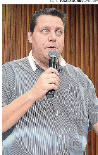
CPFL - Cagarete quer saber porque a luz apaga tanto