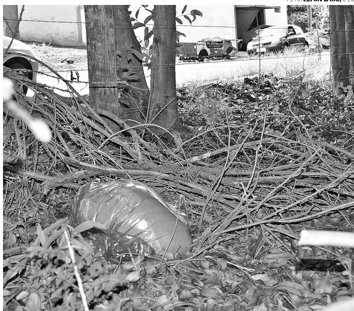
MAU CHEIRO - Animal foi deixado a menos de 30 metros das casas na Vila Paccola; Diretoria de Meio Ambiente foi informada na tarde de ontem

"A gente faz nossa parte, limpa tudo, mantém as coisas em ordem por causa do risco da dengue, mas as pessoas fazem