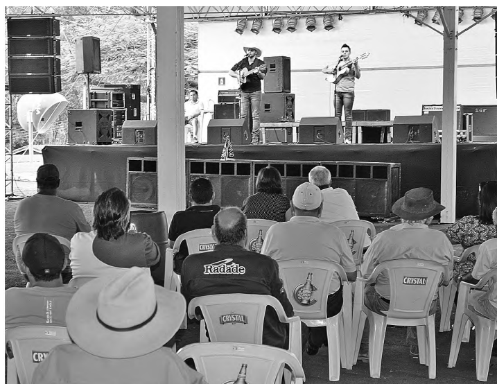
MÚSICA - Primeiro final de semana da Expovelha teve muitas atrações

Feira é o maior evento brasileiro de ovinos, resultado de muitos anos de trabalho e desenvolvimento