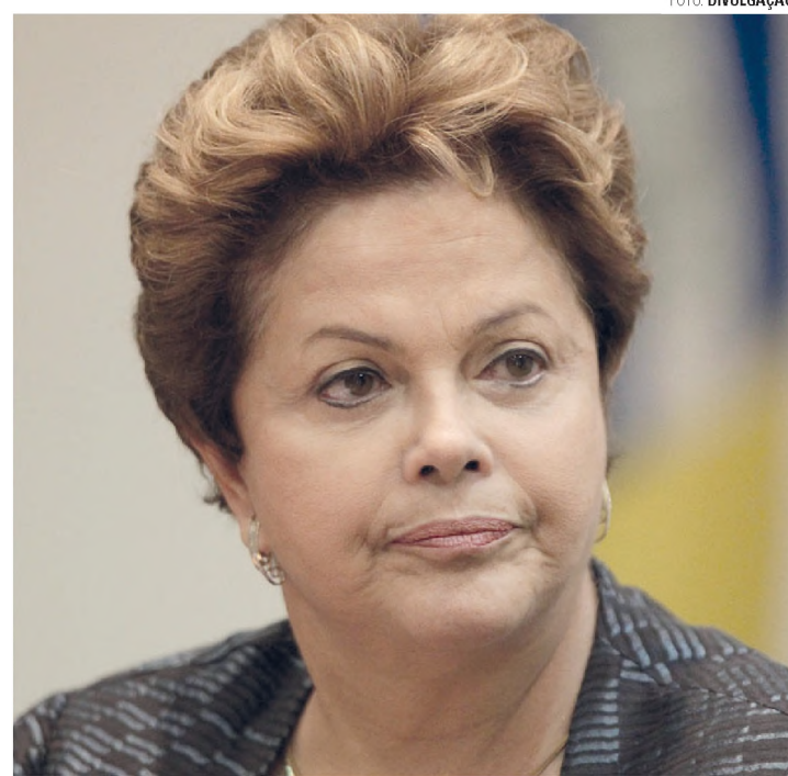
NA LUTA - Enquanto a oposição trabalha para tirar Dilma do poder, ela viaja pela País e amanhã vai estar em São Carlos entregando casas

Neste ano, até agosto, já ocorreram 111 acordos coletivos com redução nominal dos salários, quase metade deles no Estado de São Paulo. Em 2014 foram apenas quatro registros de negociações com corte no holerite, segundo levantamento da Fundação Instituto de Pesquisas Econômicas (Fipe), com base em dados do Ministério do Trabalho e Emprego (MTE). Estima-se que terminaremos um ano com a perda de 1 milhão de postos de trabalho em todo o país. Enquanto o país não resolve a crise política, a economia naufraga por falta de perspectiva.