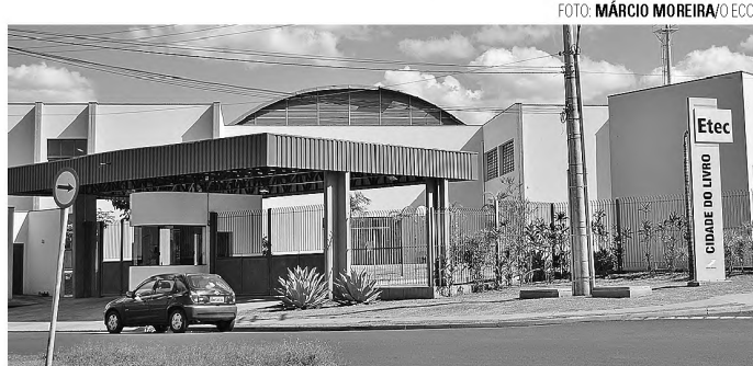
PROFISSIONALIZANTE - ETEC abre inscrição para vestibulinho

A Etec Cidade do Livro está divulgando o seu vestibulinho que se realizará no primeiro semestre de 2016. Estarão disponíveis os cursos de Técnico em Administração, Química e Informática para internet, integrados ao ensino médio e com tempo integral. Também serão oferecidos os cursos técnicos em Contabilidade, Edificações, Química e Administração, com aulas no período noturno. Ainda serão oferecidas vagas remanescentes no segundo módulo para Administração, Edificações e Logística.