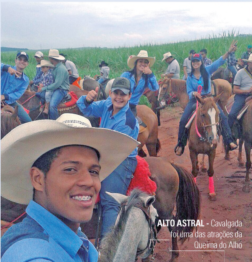
ALTO ASTRAL - Cavalgada foi uma das atrações da Queima do Alho