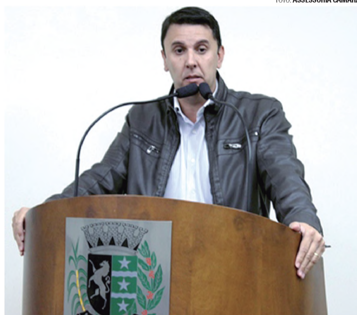
MUDANDO - Goes está deixando o partido que o elegeu

A comparação de salários entre os vereadores macatubenses e os das demais cidades é o que mais pega.