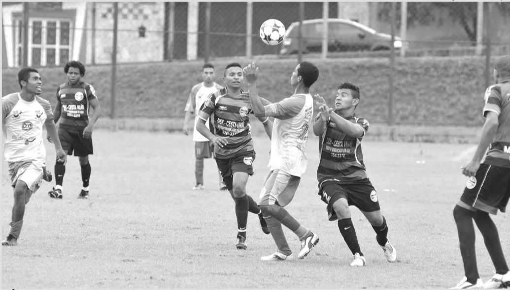
PÉ DIREITO - Atlético Paulista estreia com vitória sobre o Grêmio da Vila na série B do Amador