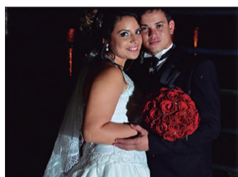
Casamentos, aniversários, Books, Fotos p/ documentos, Revelação de fotos