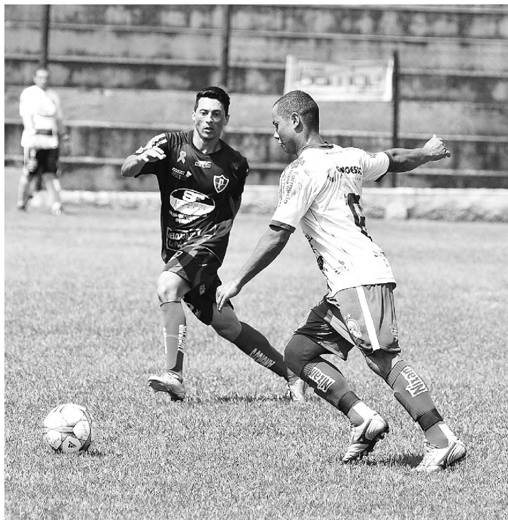
EMOÇÃO – À esquerda, jogo entre Grêmio Cecap contra o Paulistano, pela Série A, e à direita, jogo entre Nova Lençóis e Atlético Kaju pela Série B