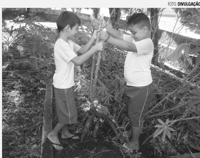
DA TERRA - Alunos da escola Yvonne Conti Capoani comemoram Dia do Índio colhendo mandioca, alimento importante da cultura indígena