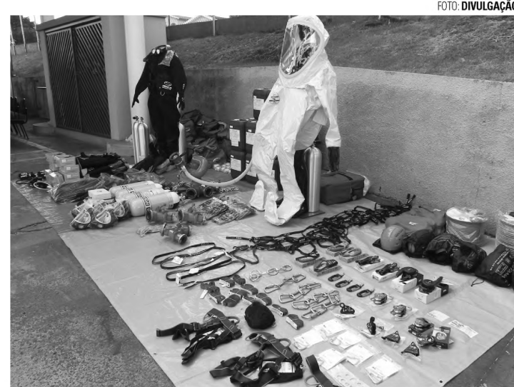
NOVO EM FOLHA — Base dos Bombeiros recebeu novos equipamentos; bombeiros e populares foram homenageados por trabalho durante a enchente

Pelo apoio ao trabalho operacional da Base de Bombeiros, o