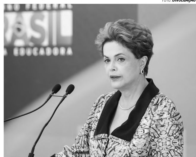
PRESSÃO - Segundo estimativas da imprensa, Senado já tem número suficiente de votos para afastar presidente

Para que o processo de impeachment tenha prosseguimento no Senado, precisa ser aprovado por maioria simples, isto é, metade mais um dos senadores presentes à sessão. Se estiverem presentes todos os 81 componentes da Casa, serão necessários pelo menos 41 votando a favor. Na votação final, o quorum para a aprovação será de dois terços, o seja, 54 dos 81 senadores. O jornal "O Estado de S. Paulo" já mantém um placar