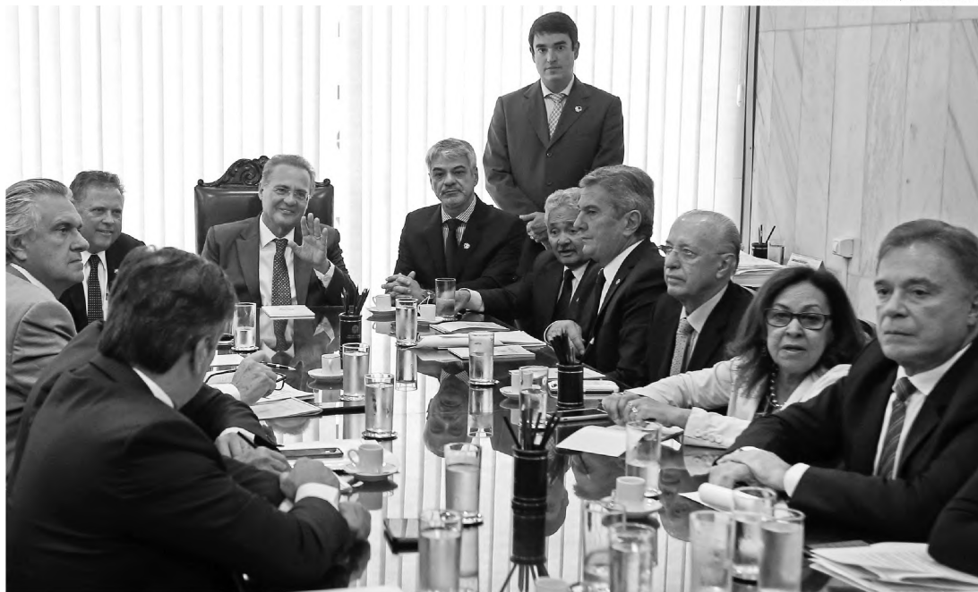
BRASÍLIA — Renan Calheiros com líderes partidários no Senado para discutir a criação da Comissão Especial do Impeachment

A partir da instalação do processo no Senado, as sessões destinadas à apuração e apreciação do impeachment serão dirigidas pelo presidente do