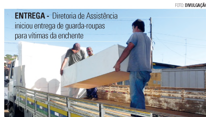
ENTREGA - Diretoria de Assistência iniciou entrega de guarda-roupas para vítimas da enchente

Além das doações, realizadas em conta corrente na CEF, impor-