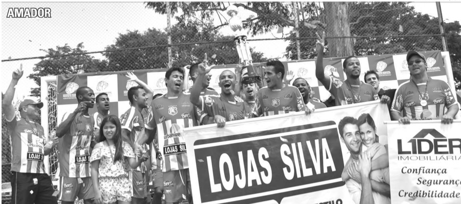
OCTA - Expressinho vence de virada e conquista oitavo título do Amador