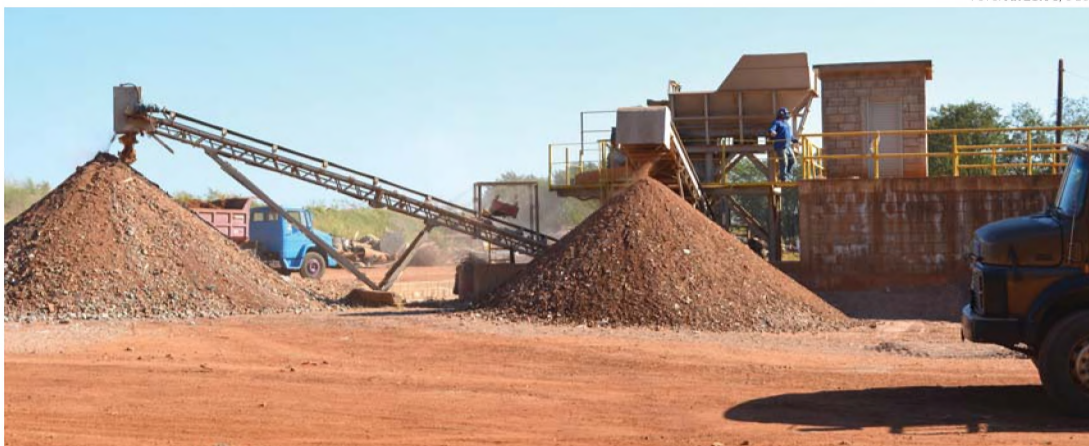
RECICLAGEM - Objetivo é aumentar eficiência do reaproveitamento para 80%