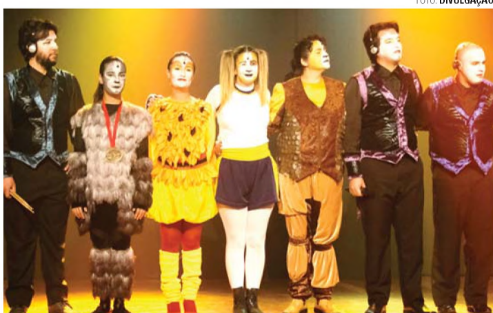
MUSICAL - Grupo Emcantar se apresenta nesta sexta-feira (6) em Lençóis Paulista

Apresentação é na sexta (6); ingressos podem ser retirados na Casa da Cultura