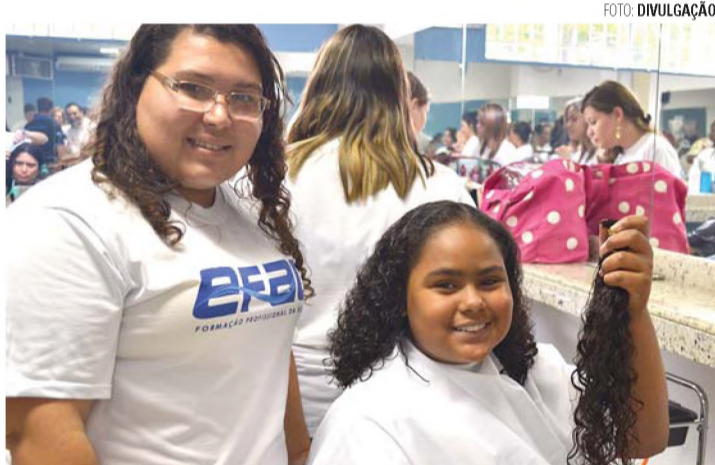
CAMPANHA - Efac arrecada mechas de cabelo para paciente com câncer

Cabelos arrecadados serão transformados em perucas para os pacientes com câncer que fazem tratamento no Hospital Amaral Carvalho