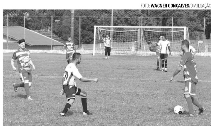
SEM PROBLEMAS - Expressinho goleia na estreia da Copa Imprensa