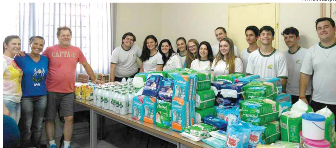
AÇÃO - Alunos da Cooperelp arrecadaram centenas de produtos para a Apae