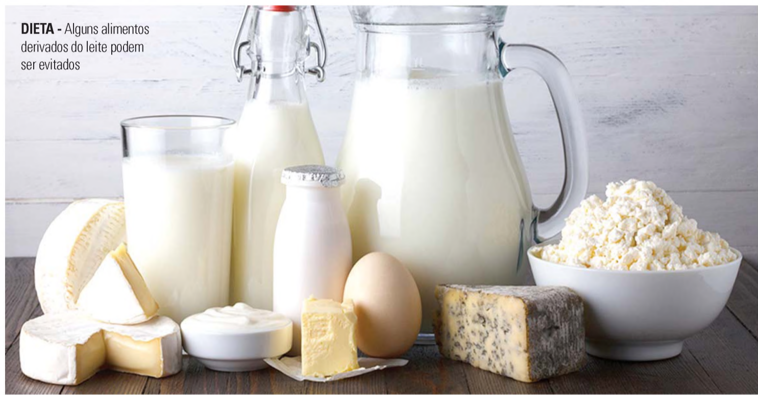
DIETA - Alguns alimentos derivados do leite podem ser evitados

Acompanhamento médico e nutricional são essenciais para o diagnóstico e manejo destas doenças