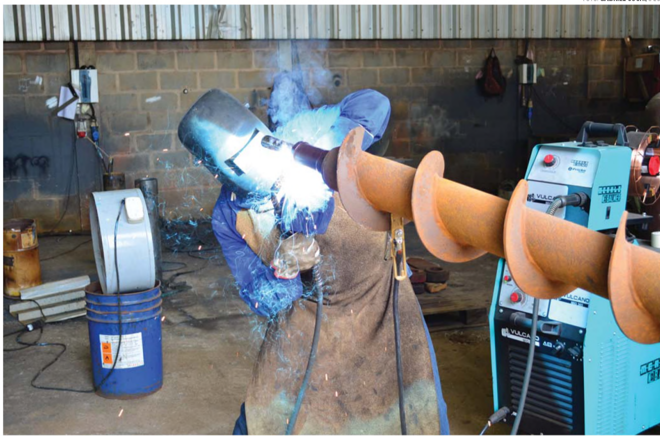
QUEDA - Indústria de transformação demitiu mais do que contratou em agosto e trouxe para baixo o saldo de empregos em Lençóis