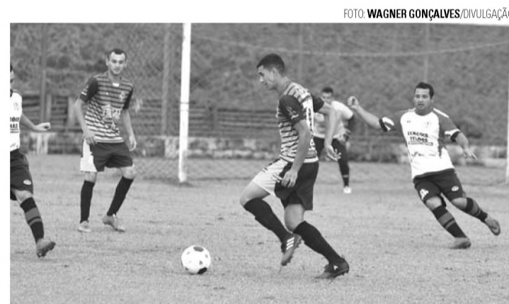
ROLO COMPRESSOR - Açaí atropela Deportivo com goleada de 9 a 0