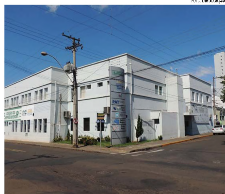
SEBRAE AQUI - Agência fica no Centro do Empreendedor de Lençóis Paulista

A oficina, que acontece no Centro do Empreendedor, tem parceria da Prefeitura Municipal de Lençóis Paulista, do Sebrae São Paulo, da Ascana (Associação dos Plantadores de Cana do Médio Tietê) e do Grupo Lwart.