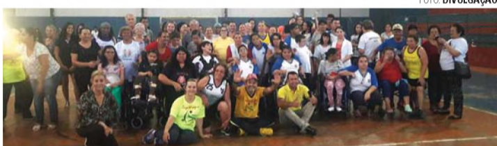
AGITA GALERA - População participou do evento na última sexta-feira (25) em Areiópolis

A intensão do evento é garantir mais interação, entreteni-