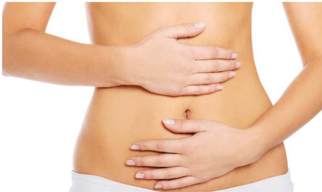
SEGREDO - Boa hidratação, quantidade adequada de fibras e nutrientes contribuem para o fluxo das fezes no intestino

E esse problema é mais comum do que se imagina: de acordo com a Análise do Consumo Alimentar Pessoal no