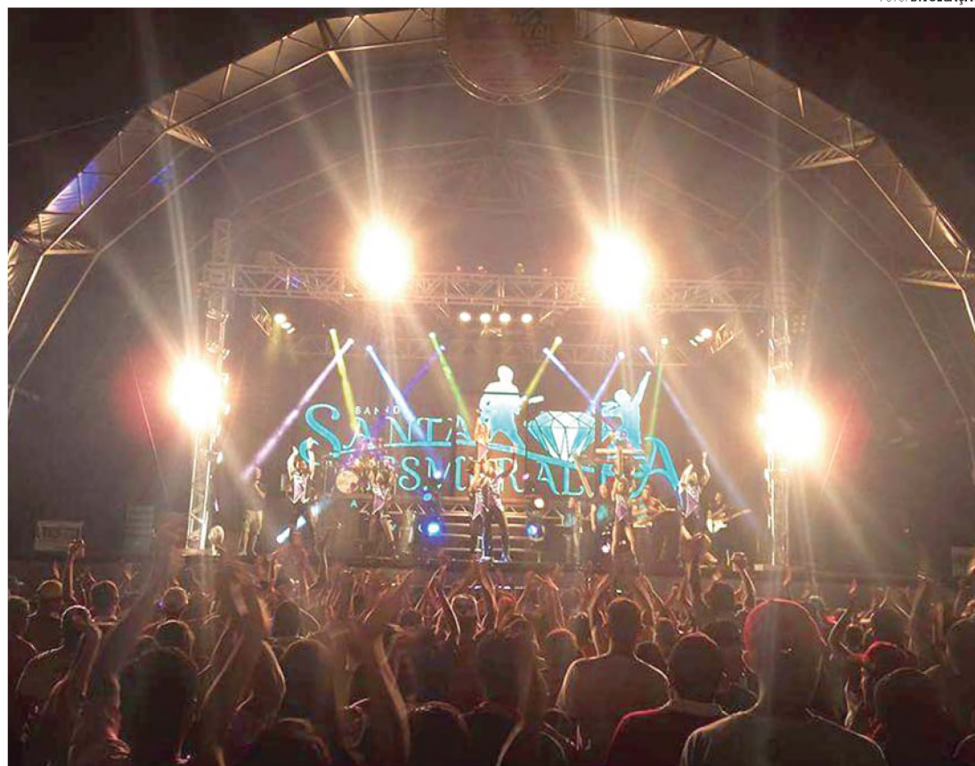
BANDA - Evento será encerrado pela banda Santa Esmeralda