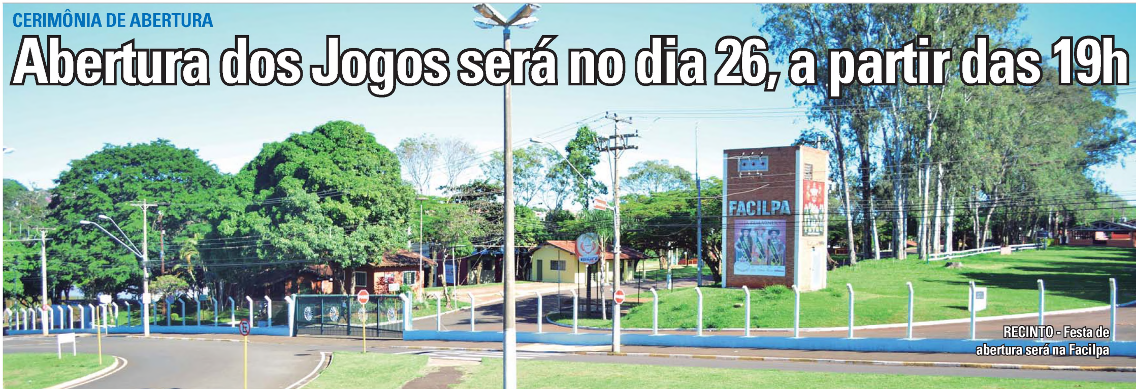
RECINTO - Festa de abertura será na Facilpa