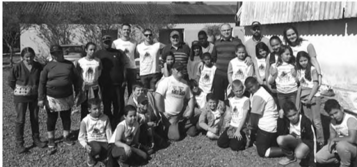
PRESERVAR É PRECISO - Participantes visitaram o Projeto Lixo Rico

Cerca de 20 crianças participaram do “Reciclar - A Arte de Transformar”