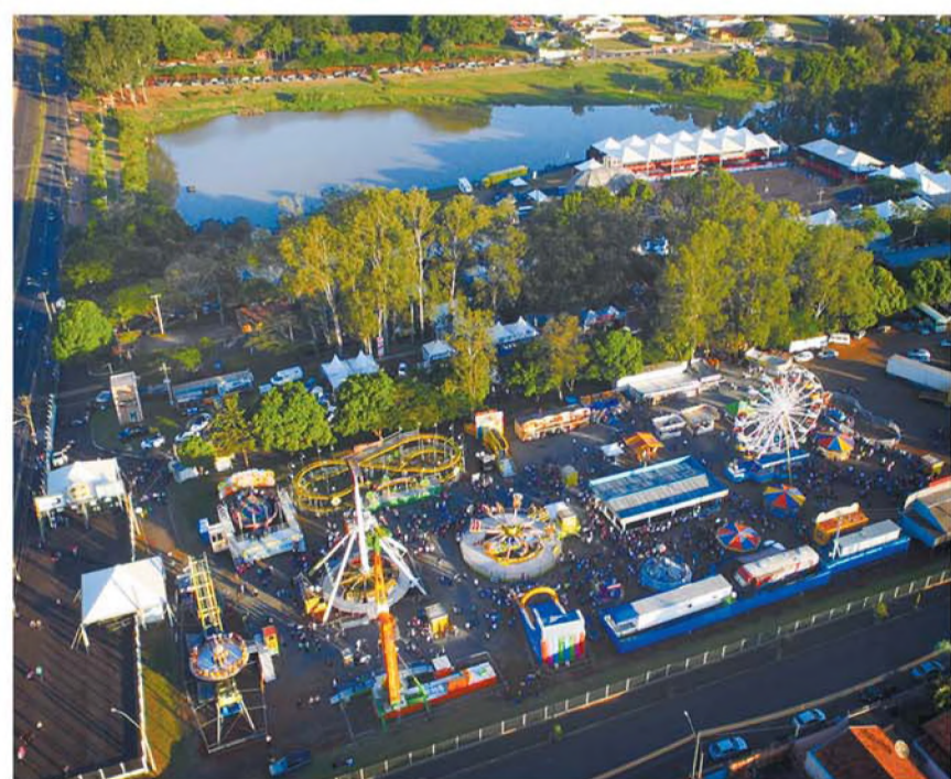
A responsabilidade social faz parte da programação permanente da Facilpa.

A Facilpa que encanta milhares de pessoas pela grandeza e pela diversidade das atrações durante o evento também é a fonte de receita para manutenção de inúmeras ações sociais que acontecem no município e que se estendem pelos 12 meses do ano, acolhendo com espírito humanitário pessoas de todas as idades.