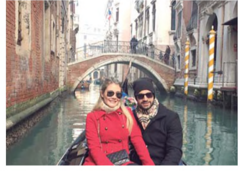
VOLTA AO MUNDO - O casal também visitou alguns lugares bem clássicos, como o Coliseu, em Roma; a Muralha da China, os canais de Veneza, entre outros