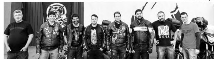
MOTO ROCK - Motociclistas de toda a região se reúnem na Marechal Lounge no dia 9 de julho

1º Revolução Moto Rock acontece na Marechal Lounge no dia 9 de julho