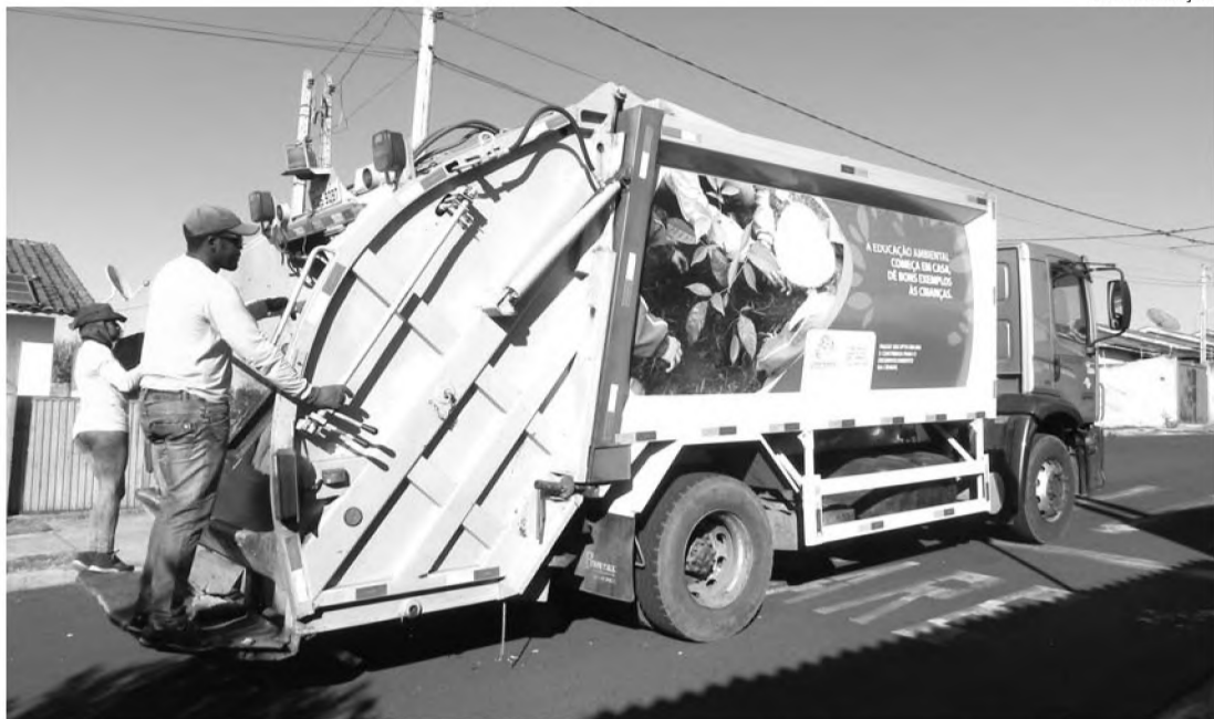
MUDANÇA - Prefeitura de Lençóis antecipa coleta de lixo em duas horas em alguns bairros

Nos locais onde o serviço era iniciado às 17h as equipes começarão a passar às 15h