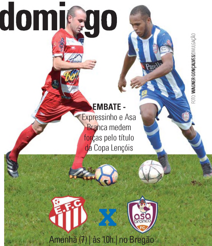
EMBATE - Expressinho e Asa Branca medem forças pelo título da Copa Lençóis

A primeira rodada do Brasileiro 2017 acontece daqui a uma semana, no dia 13 de maio, e o Cartola FC já está no ar. Se você ainda não montou seu time, corre que ainda dá tempo de entrar na Liga Jornal O ECO e concorrer aos prêmios desta edição. Mais detalhes na edição da quarta-feira (10). Aguardem!