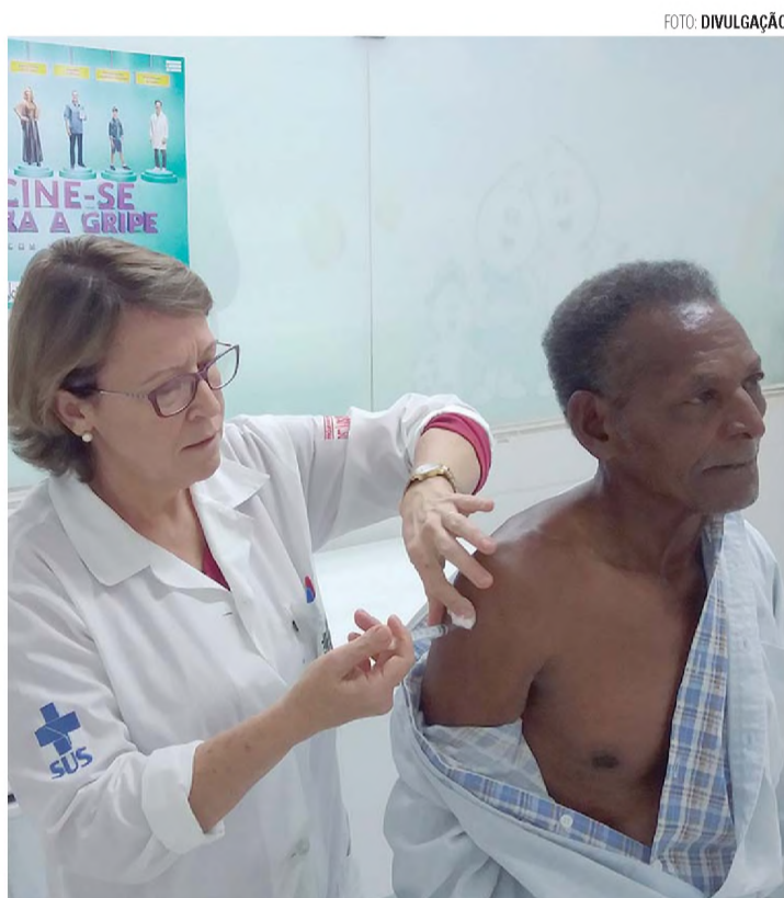
GRIPE - Vacina está disponível em todas unidades de saúde de Lençóis

Disse também que a vítima era conhecida da polícia local, mas que não tinha passagem por nenhum delito. "O que eu posso falar no momento é que não sabemos o motivo e que esse adolescente que foi vítima deste crime já foi abordado algumas vezes pela PM, mas não temos informações de envolvimento dele com nada ilícito", destacou o tenente.