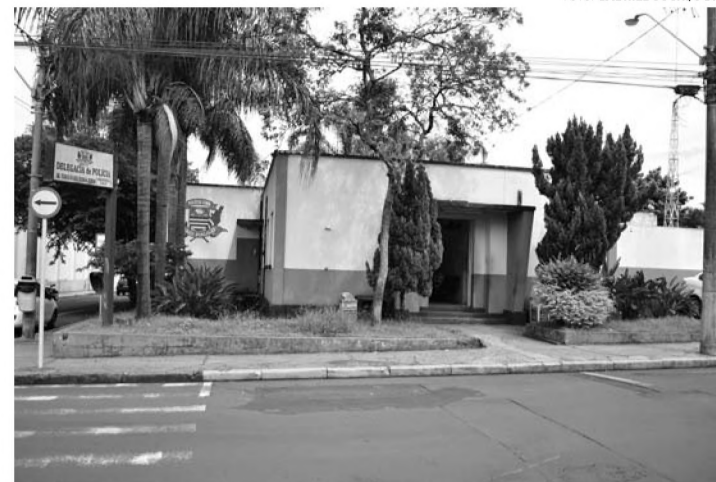
BUSCAS - Polícia procura por autor de segundo homicídio do ano