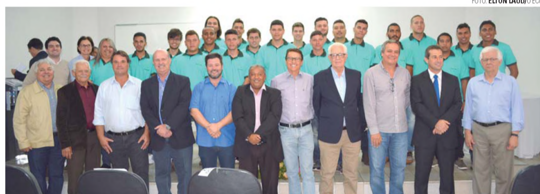
PIONEIROS - Projeto iniciado em Lençóis será utilizado como modelo para novas turmas