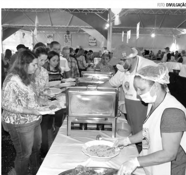
SABORES - Tradicional pelo cardápio, Festa do Milho Verde chega à 42ª edição

A 42ª Festa do Milho Verde acontece na Avenida Prefeito Jácomo Nicolau Paccola, 503, ao lado do posto Bremen.