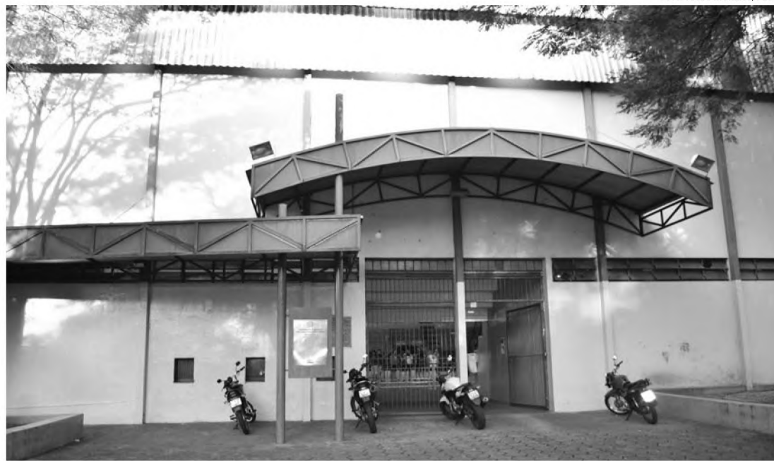
JARDIM YVONE - Inscrições serão feitas no ginásio do Tonicão, a partir desta sexta-feira

Pessoas que têm a renda mínima para o financiamento, mas não têm como comprovar, também podem apresentar extratos bancários, contas de