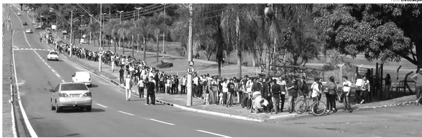
FILA QUILOMÉTRICA - Mais de 2,7 mil pessoas enfrentaram fila para entregar currículos e visitar estandes no Feirão do Emprego