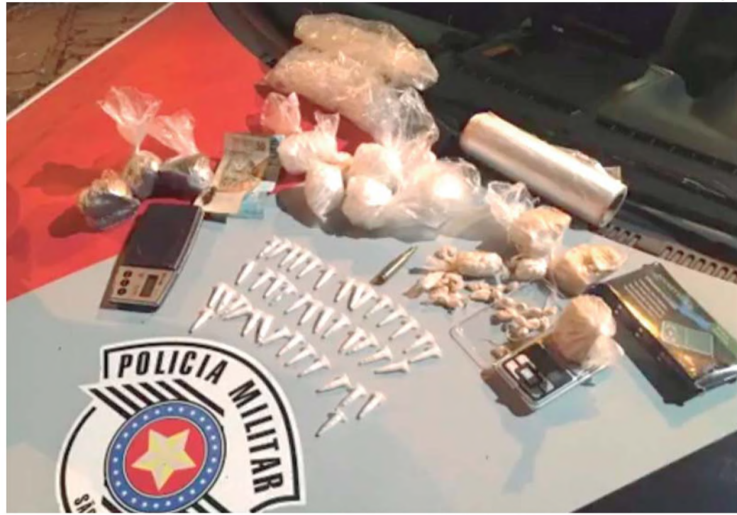
Jovem levava crack, maconha e cocaína; apreensão ocorreu no último domingo, no Jardim Caju

Jovem de 20 anos foi autuado em flagrante e permaneceu à disposição da Justiça