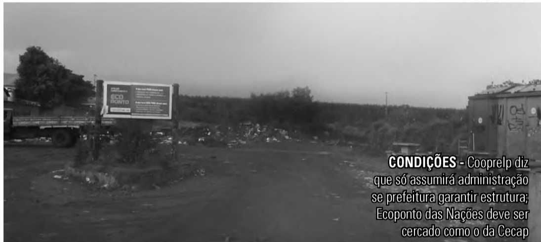
CONDIÇÕES - Cooprelp diz que só assumirá administração se prefeitura garantir estrutura; Ecoponto das Nações deve ser cercado como o da Cecap

Os Ecopontos têm acumulado desde sua implantação uma série de problemas e, por vezes, causado transtornos à população de Lençóis Paulista. O principal deles, conforme já relatado em outras reportagens publicadas pelo Jornal O ECO, é o descarte irregular de materiais, como lixo doméstico, resíduos industriais e entulho de construção acima do limite permitido, que é de 0,5 metro cúbico. Agora, a Diretoria de Agricultura e Meio Ambiente espera acabar com o problema passando a administração dos locais à Cooprelp (Cooperativa de Reciclagem de