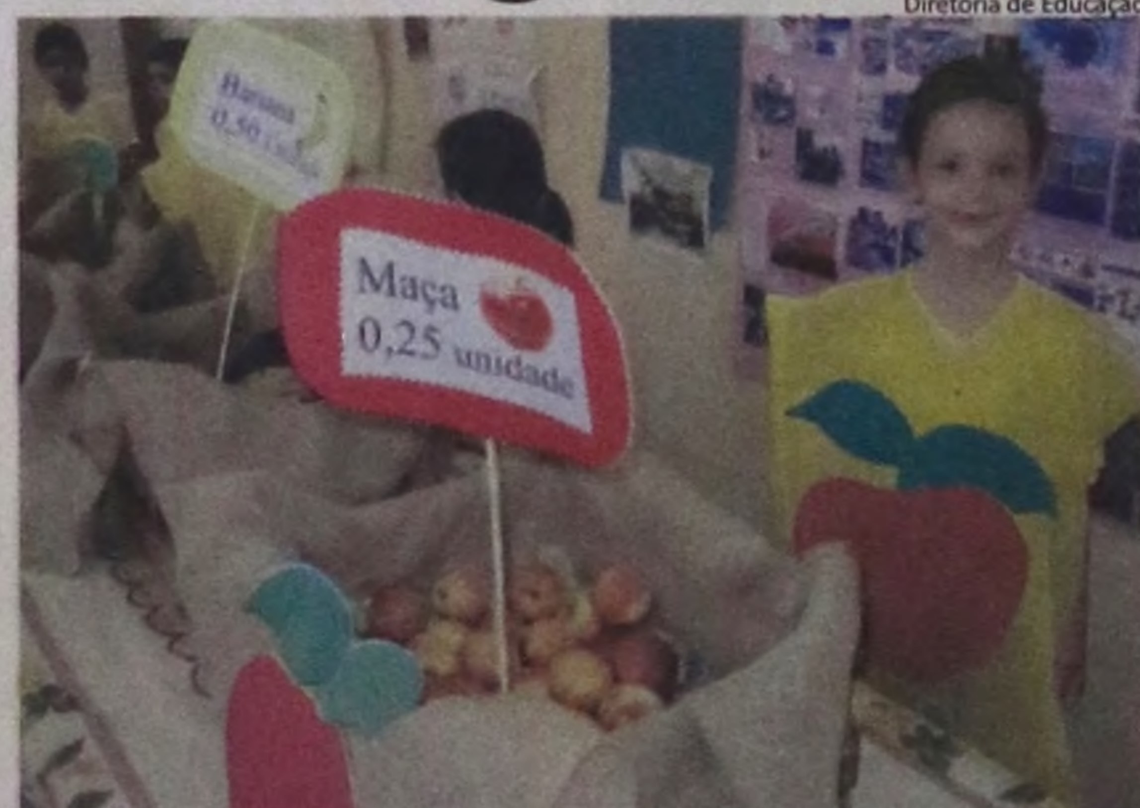
Alunos usaram dinheiro de brincadeira para comprar as frutas

Os alunos usaram dinheiro de brincadeira para comprar as frutas que mais gostam, podendo escolher entre melancia, abacaxi, banana, maçã e melão. Foi uma maneira prática, divertida e saborosa para aprenderem a negociar e a identificar o valor monetário.